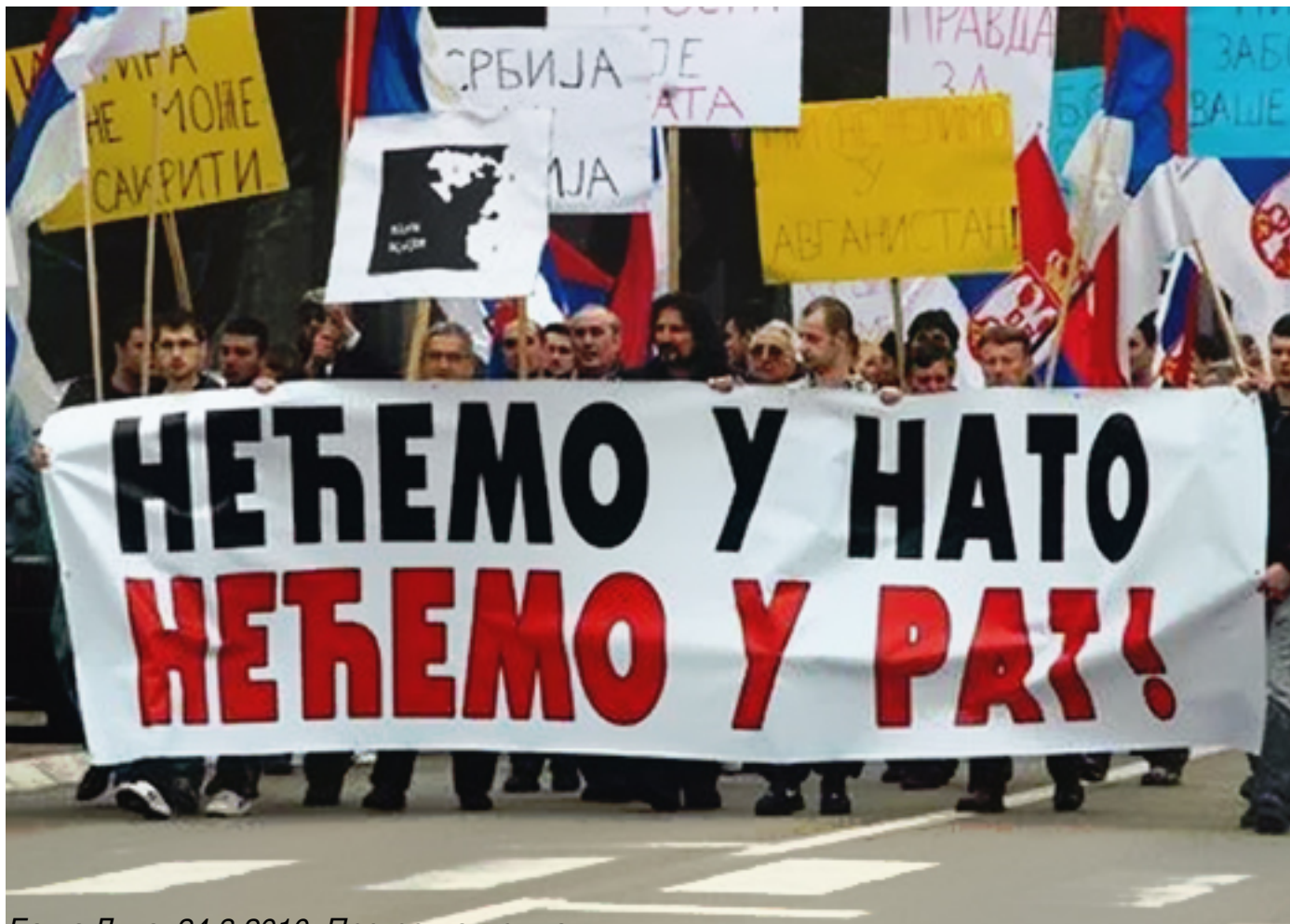
Бања Лука, 24.3.2010; Протестна шетња