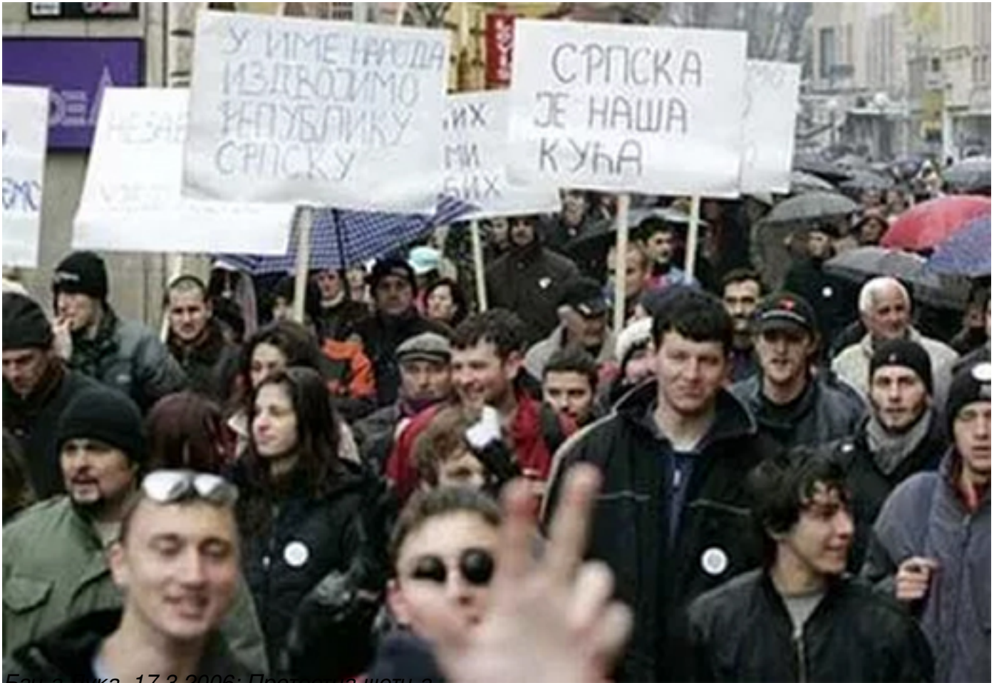
Бања Лука, 17.3.2006; Протестна шетња