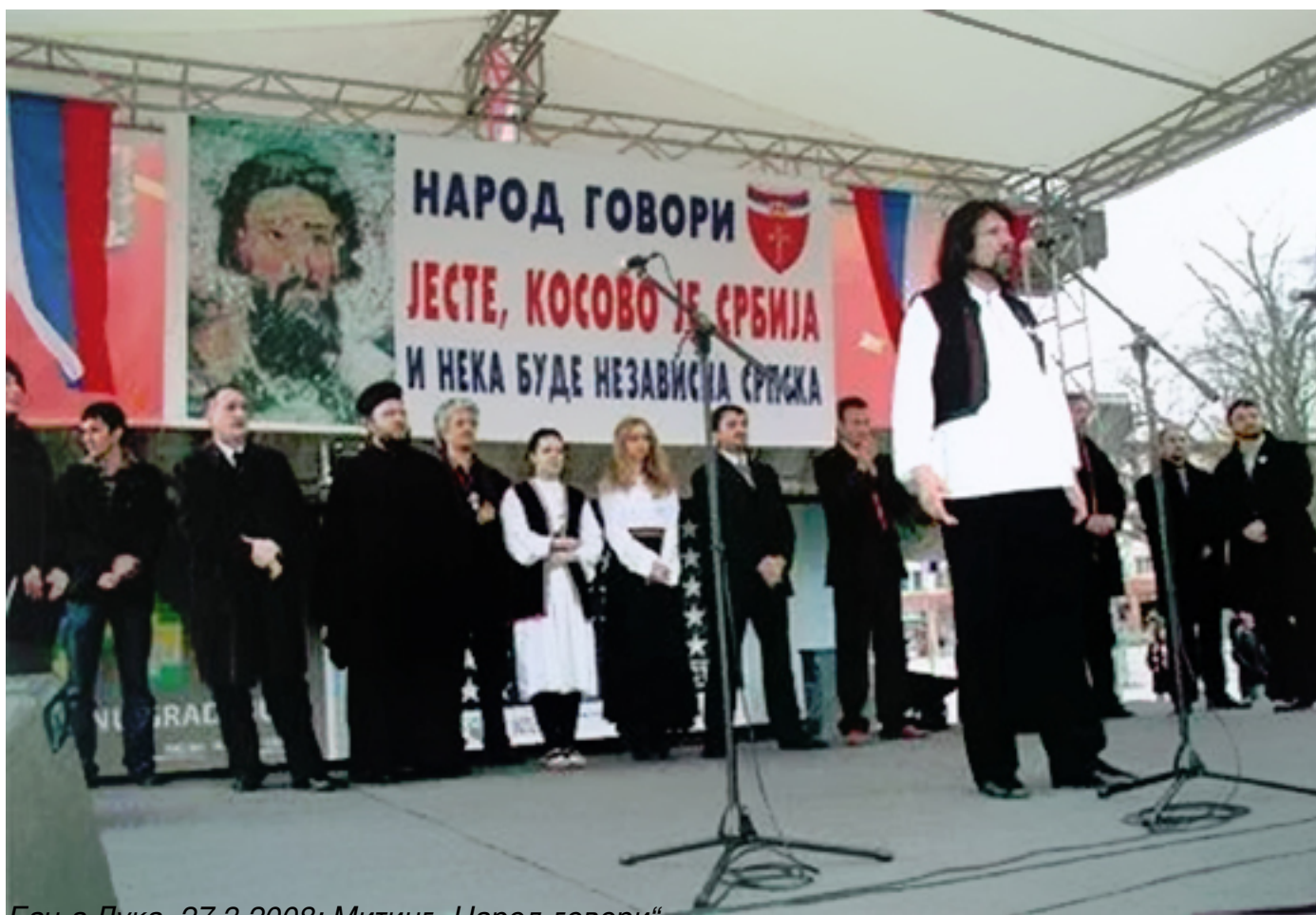
Бања Лука, 27.3.2008; Митинг „Народ говори“