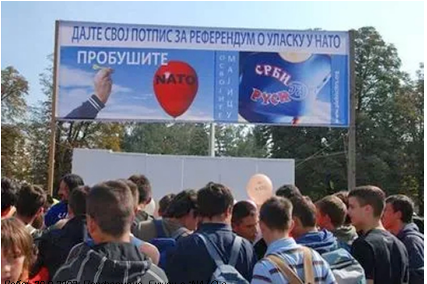
Добој, 30.9.2009, Перформанс „Бушење НАТО-а