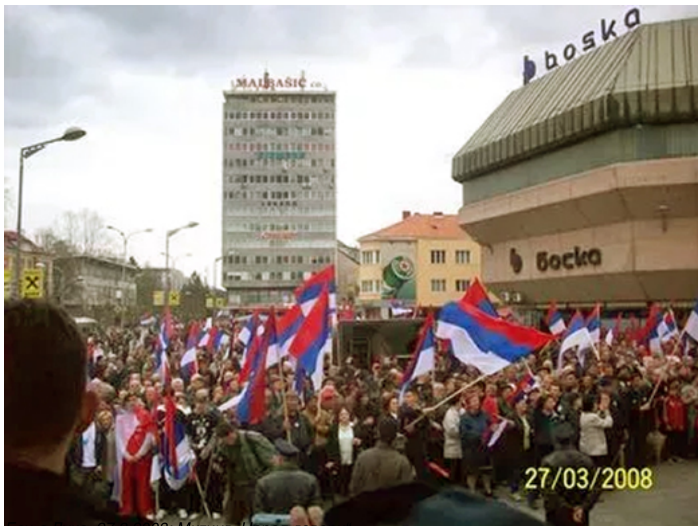
Бања Лука, 27.3.2008; Митинг „Народ говори“