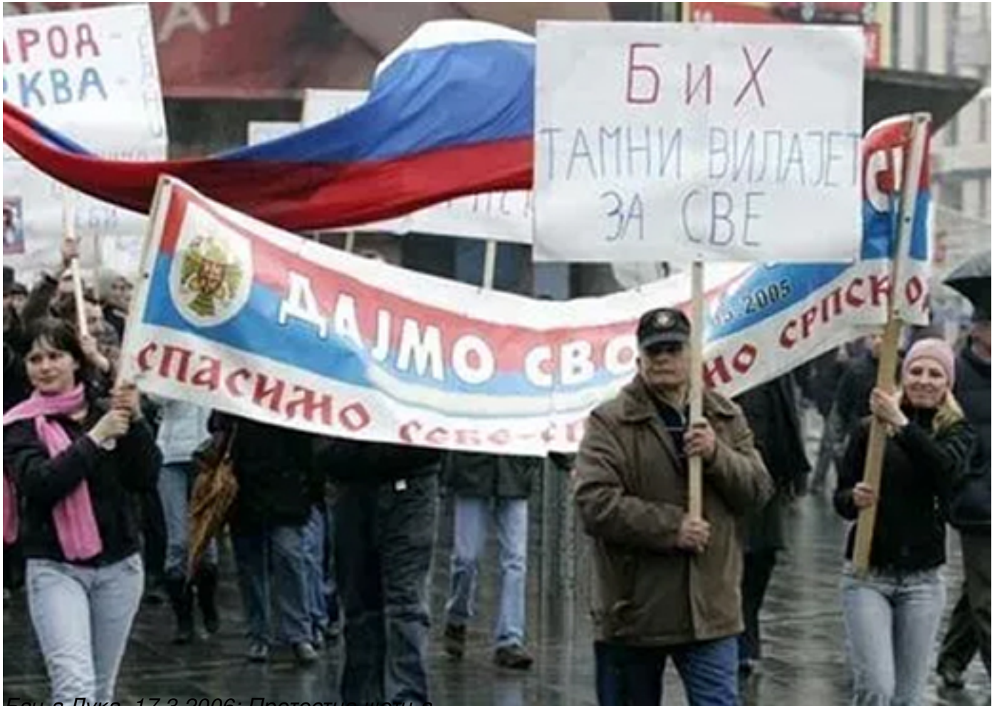
Бања Лука, 17.3.2006; Протестна шетња