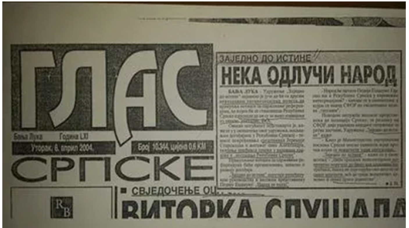
Насловна страница Гласа Српске на којој је саопштење „Народ се пита“

Једног дана слободно човјечанство славиће 9. јануар када је 1992. настала Српска Република.