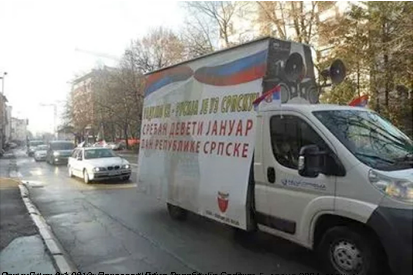
(Фотодатум: 05. април 2024. године)

Пише: Дане Чанковић субота, 06 април 2024 21:06