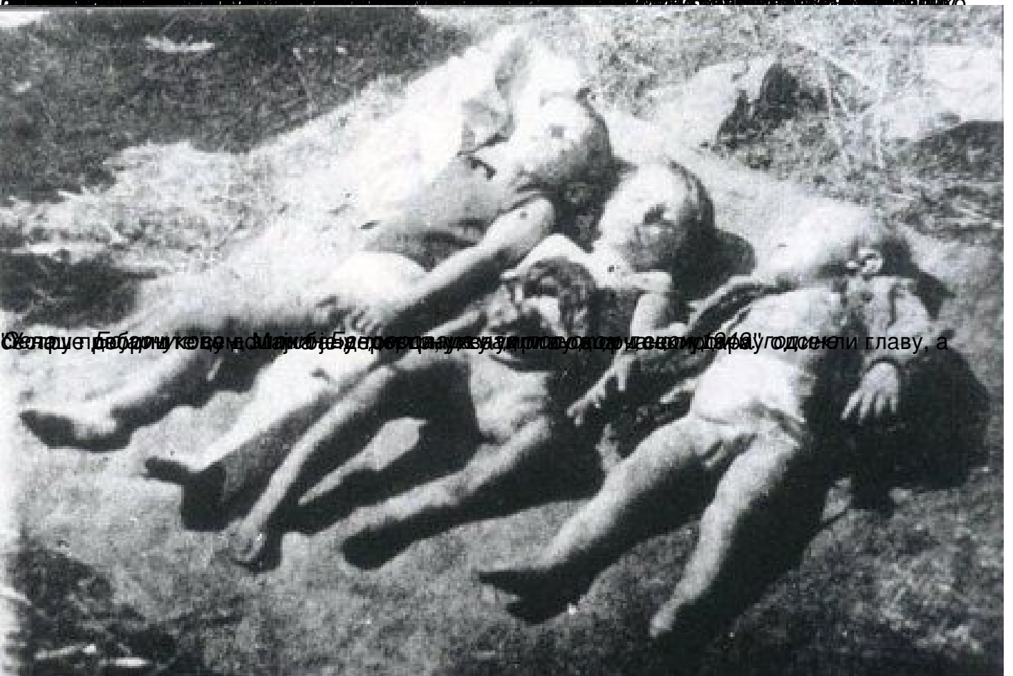
Услед бајачикуве, Мајко Бајачикуве, у злочину од ове деценије, угод се ли главу, а