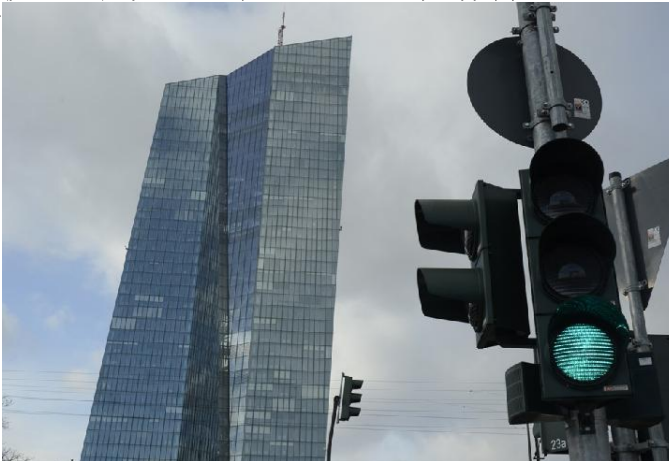
Зграда Европске централне банке у Франкфурту

Брисел увелико планира да одговори променом сопствених правила којим ће се употреба субвенција проширити. Повезано с тим, једном трећином од 1.800 милијарди евра у оквиру Плана опоравка „NextGenerationEU“ финансираће се „Европски зелени договор“ (уведен 2019), који ће помоћи државама чланицама да улажу у пројекте чисте енергије.