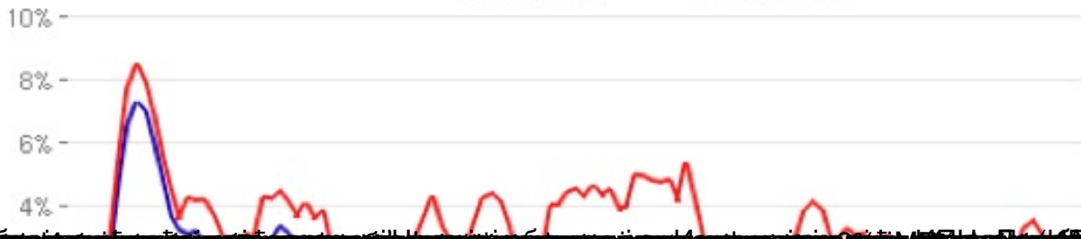
Real Median Household Income Index (Monthly Level) Through March 2012, Seasonally-Adjusted (www.SentierResearch.com)