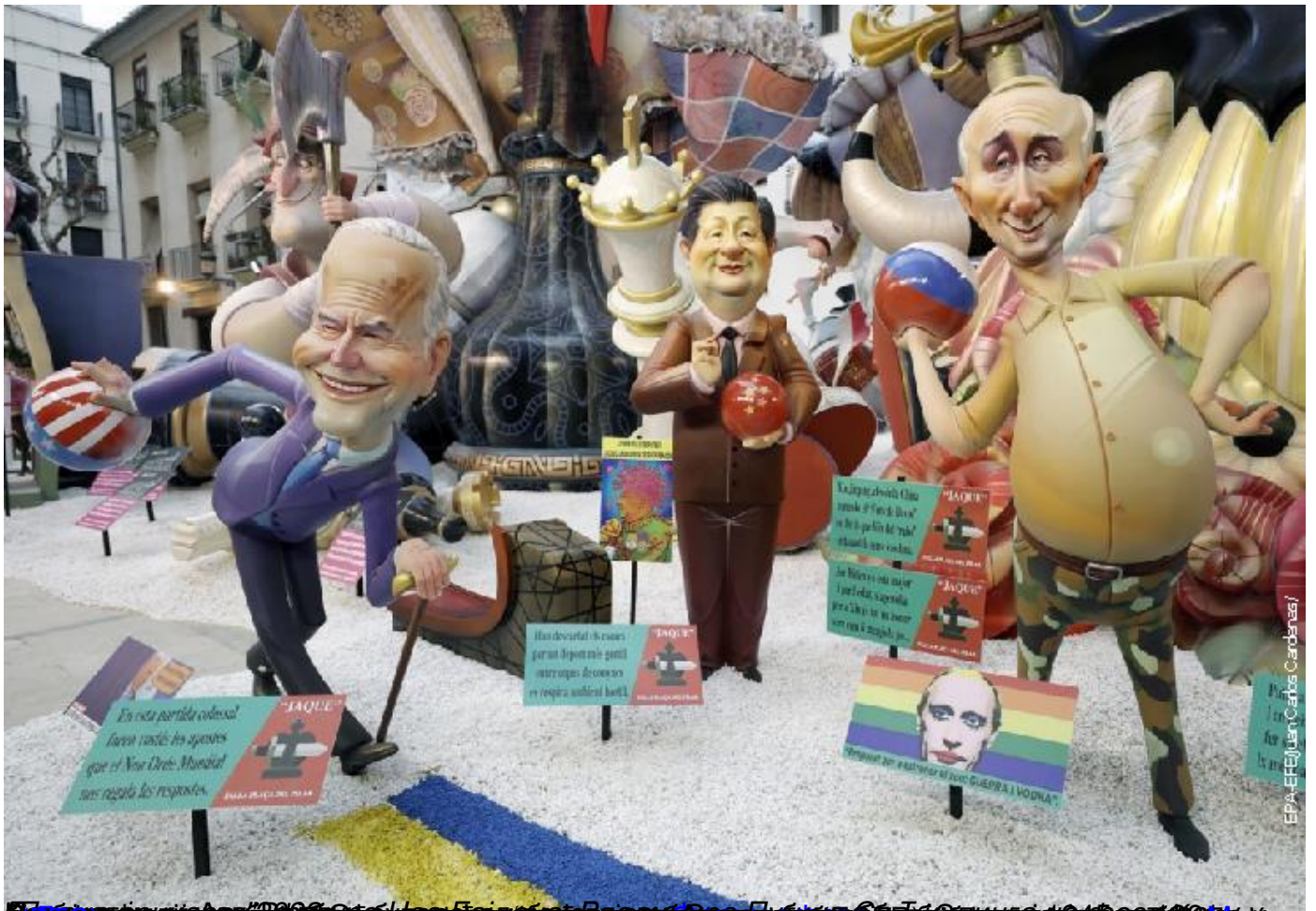
Fallas de Valencia: Joe Biden, Xi Jinping i Donald Trump. Des de l'esquerra a la dreta: Biden, Xi i Trump

Пише: Горан Николић четвртак, 21 септембар 2023 11:00