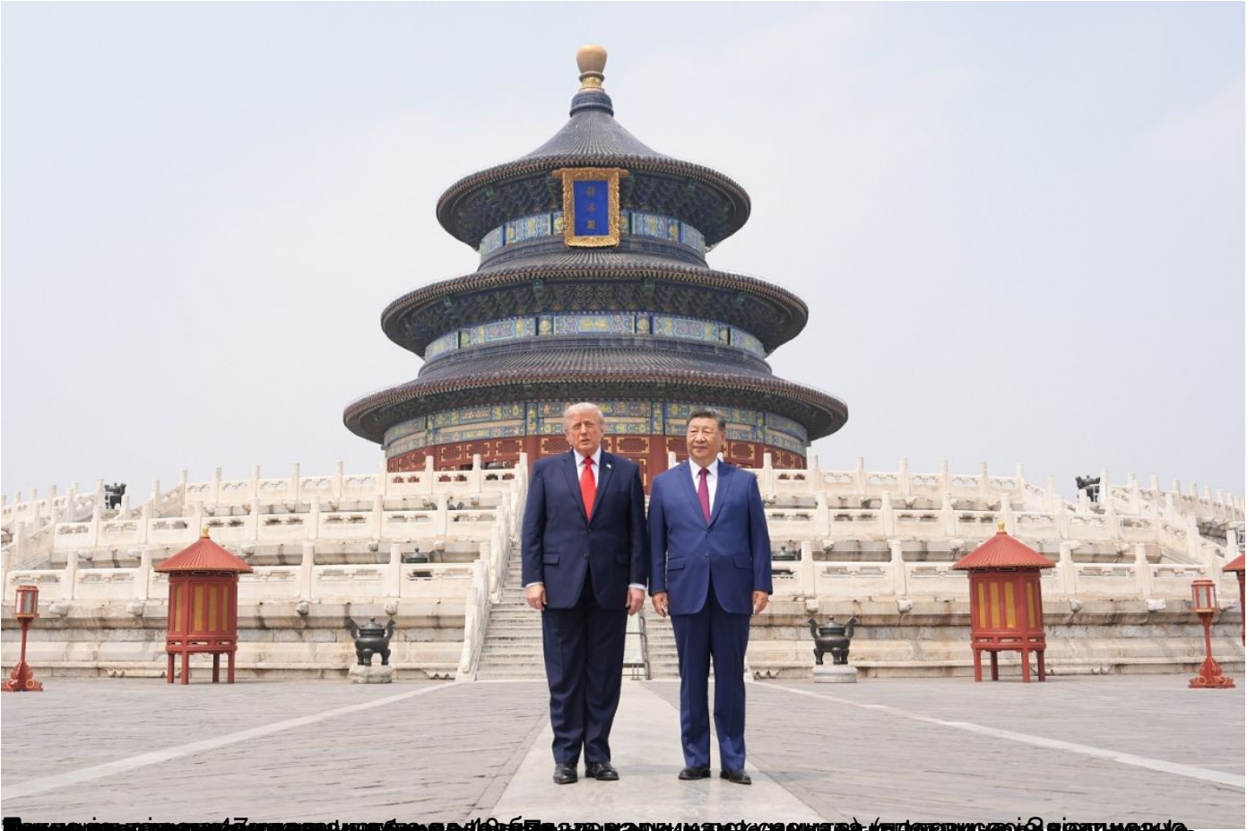
Donald Trump and Xi Jinping standing in front of the Temple of Heaven in Beijing.

Пише: Арон Леа и Борух Таскин недеља, 24 мај 2026 10:12