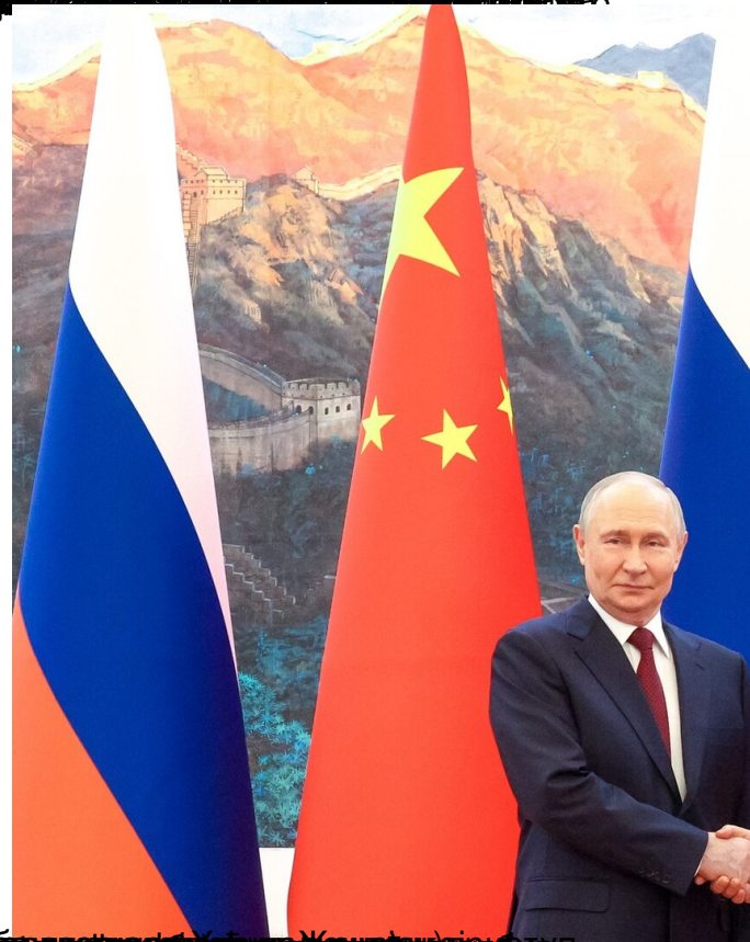
Vladimir Putin standing in front of the Russian and Chinese flags.