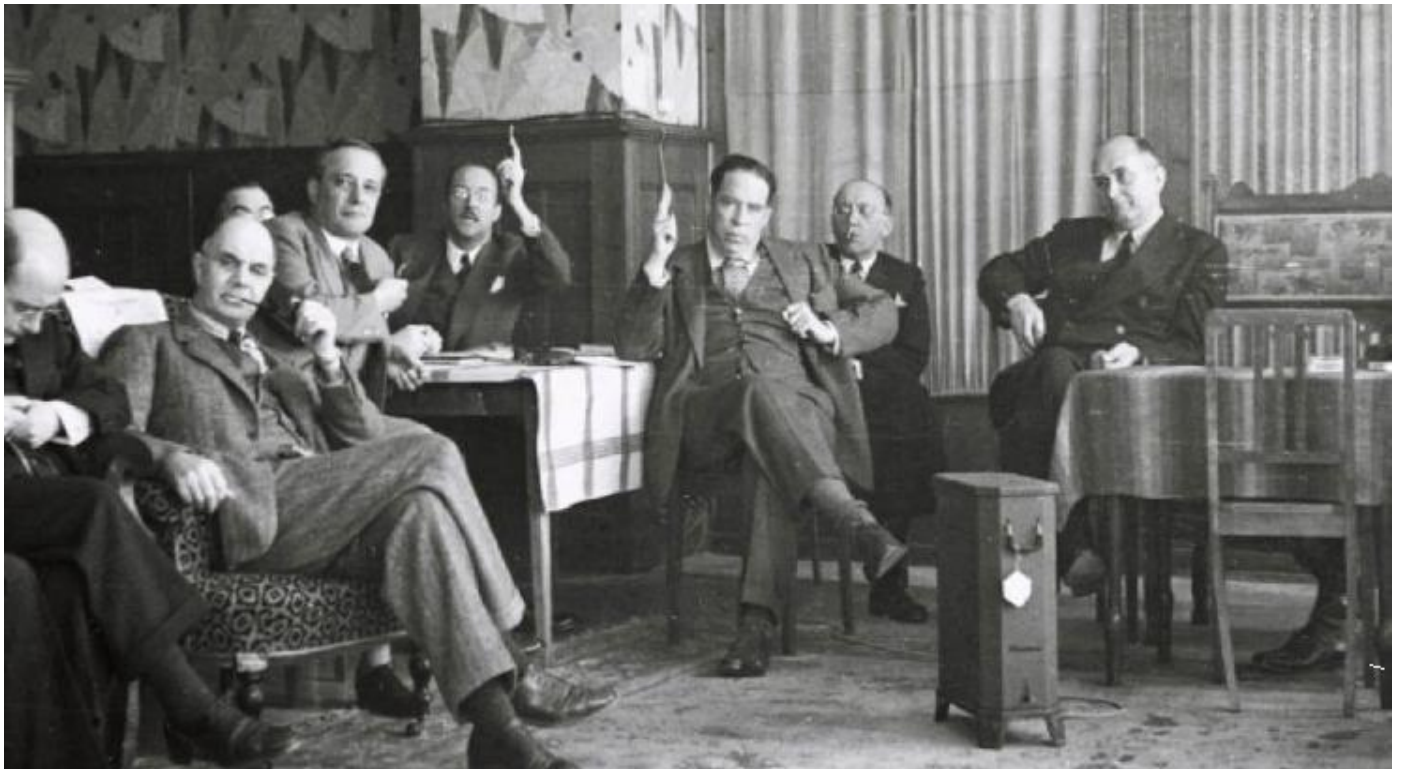
Чланови Удружења Монт Пелерин, 1947.

Да би космополитизам створио глобално богатство и благостање, свет је морао бити компетитиван. Људима не само да би било допуштено да се такмиче једни с другима, без обзира на националне границе, већ би на то били и подстицани – излагањем свих добара која би могла постати њихова, као и друштвеним признањем које прати победу у таквом надметању.