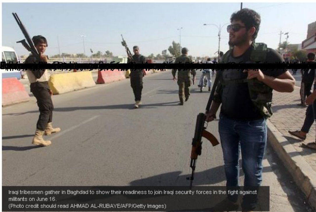
Iraqi tribesmen gather in Baghdad to show their readiness to join Iraqi security forces in the fight against militants on June 16.

Analysis | JUNE 17, 2014 | 0709 | Print | Text Size