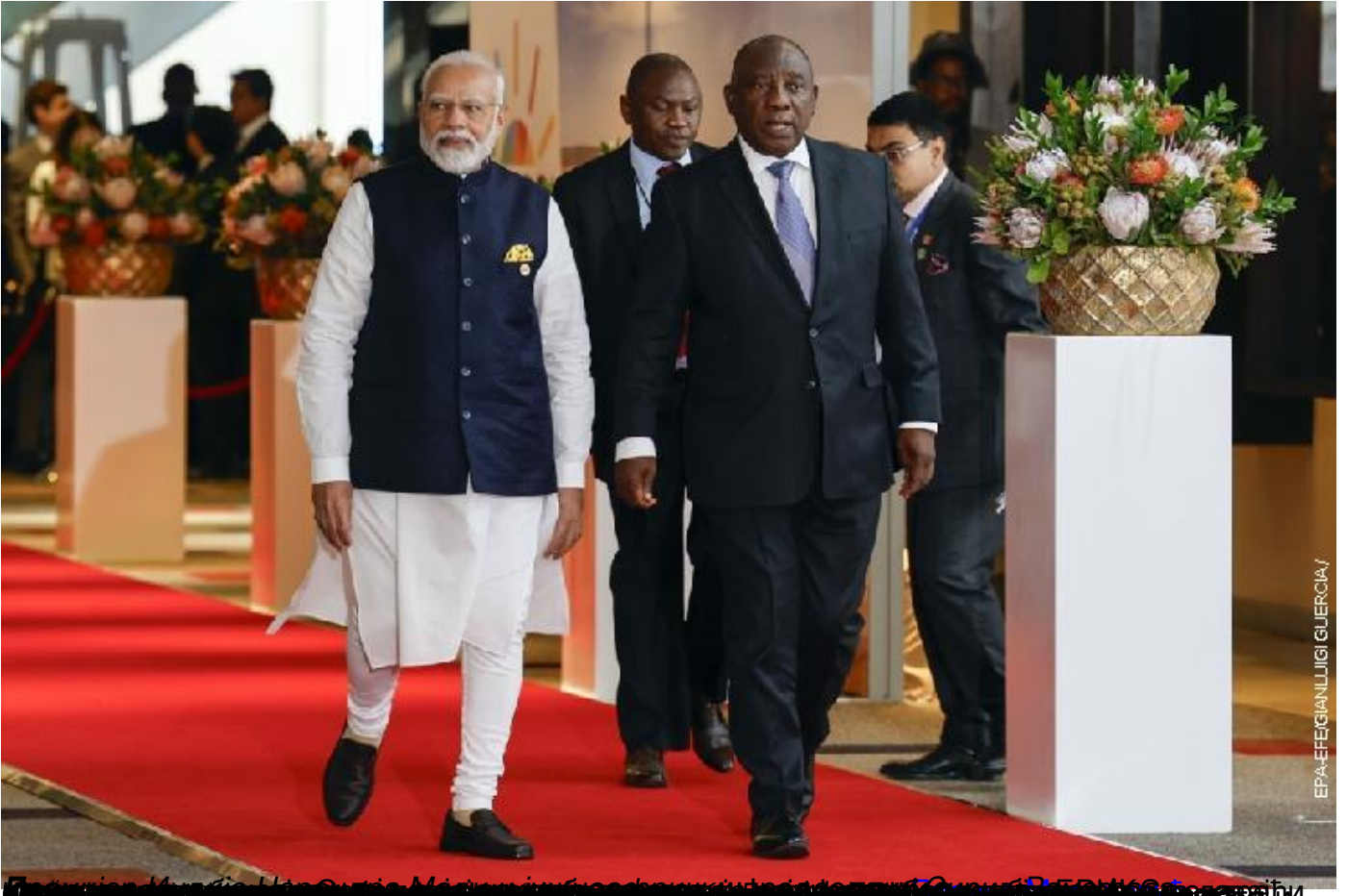
Државни министар Африке и председник Афричког савеза Мууса Факи Махамед са индијским премијером Нарендром Модим на почетку самита у Јоханесбургу.

Пише: Ана Оташевић уторак, 29 август 2023 09:57