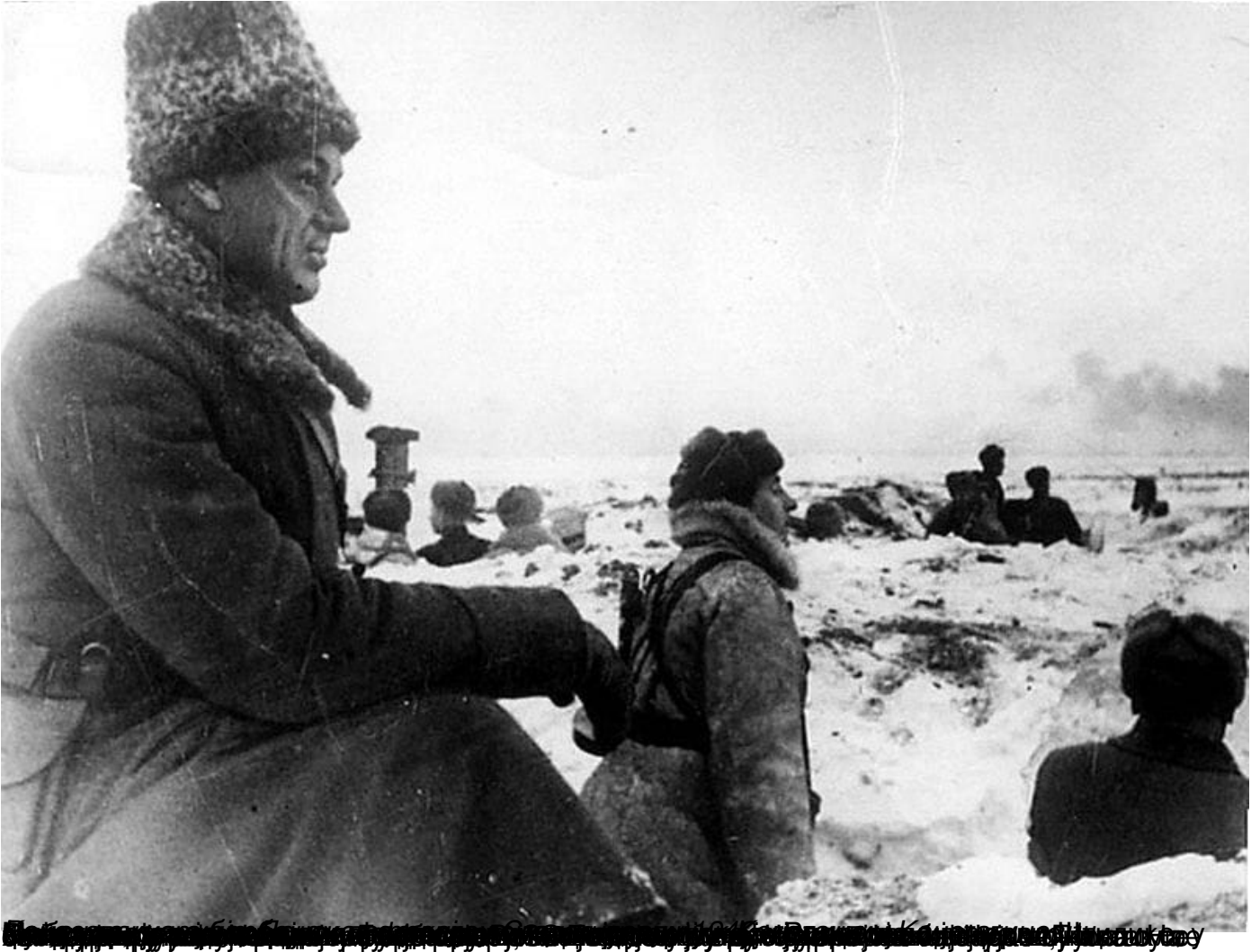
Поборници за Стаљинград, 1942.

Пише: Ђорђе Милошевић субота, 27 јануар 2024 09:00