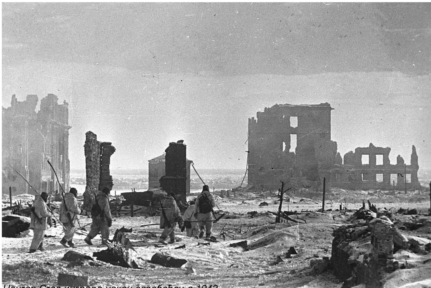
Нацист Сталинградској цркви ослобођен 1943

Пише: Ђорђе Милошевић субота, 27 јануар 2024 09:00