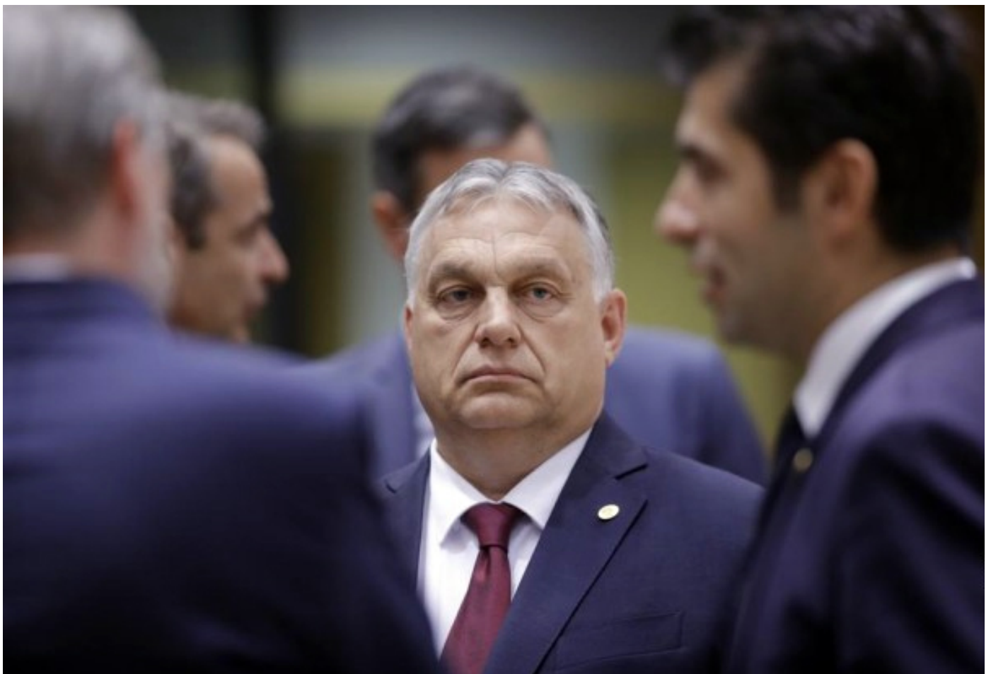
Мађарски премијер Виктор Орбан

Мађарски премијер Орбан делује ових дана као политички катализатор Европске уније. У говору пред мађарском мањином у Трансилванији, као и приликом службене посете Бечу прошле седмице, политика и медији у Унији су у непрестаној конфронтацији са његовим тезама. Орбанова изјава да је политика санкција против Русије доживела дебакл се принципијелно не негира, али се одмах додаје „за сада“. Уместо трезвеног погледа на насталу „гасастрофу“, ЕУ и њене главне чланице бирају останак на досадашњој траси као једином начину за њено напуштање. Донели смо погрешну одлуку, али сад свеједно идемо даље!