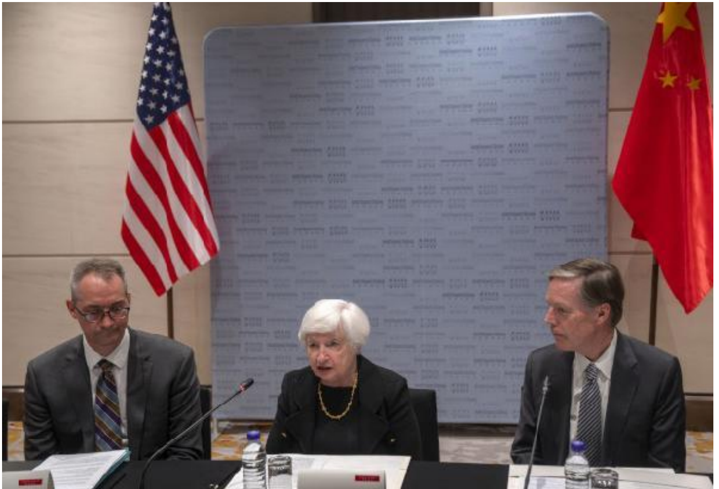
Министарка финансија САД Јелен у Пекингу

Но убрзо, у јулу, у Северну престоницу (што је буквално значење речи Беиђинг, односно, Пекинг) је пристигла министарка финансија Јелен, и онда, још интересантније, бивши државни секретар Кисинџер који се педесет година раније уписао у анале синоамеричких односа, када је испреговарао поновно успостављање прекинутих дипломатских веза између две земље и комунистичког дива приволео на блиску обавештајну сарадњу усмерену против Совјетског Савеза.