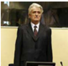
Радован Караџић, у Хашком трибуналу:

"Немам примедбе на понашање службених лица, био сам и на горим местима. Уз све поштовање према запосленим у суду, бранићу се као од сваке елементарне непогоде." (01. август 2008, "Политика")