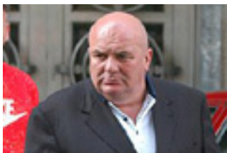
Субаше и испаше