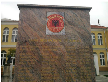
Спорни споменик у Прешеву

С обзиром да ће се питање Косова разрешити овако или онако, углавном без Срба, а судећи по најновијем (не)дипломатском испаду премијера Дачића да се може разговарати и о столици Косова у Уједињеним нацијама, процењено је да је дошло на ред питање око уставног статуса Војводине. На југу Србије се одавно вештачки закувава политичка нестабилност и поред тога што укупно у Бујановцу, Медвеђи и Прешеву живи приближно исти број Срба и Албанаца. На целу ову тужну причу са неизвесним крајем, надовезује се и проблем око споменика у Прешеву погинулим терористима ОВПБМ („ослободилачка војска Прешева, Бујановца и Медвеђе“). Проблем није решен одмах, чим се почело са градњом, већ се по добром српском обичају, одуговлачило. И на крају, настали су озбиљни проблеми за које Србија нема решење.