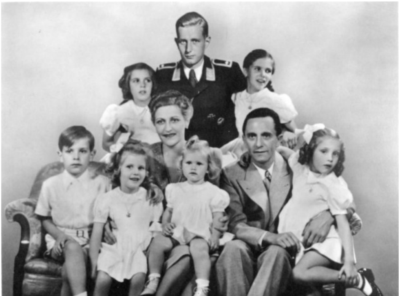
Породица Гебелс 1942: Јозеф и Магда са децом и Харалдом Квантом (у униформи),

На неколико места Лонгерих као рефрен понавља да је Гебелс имао „дефиците“ у карактеру, у смислу да је био гљива, не човек; следбеник, не креатор, те да није био толико моћан колико се хвалисао да јесте. Рецимо, каже Лонгерих, Гебелс није знао да ће Хитлер потписати пакт са Стаљином, шеф га је потпуно оставио у мраку. Такав поглед је разумљив за једног историчара, јер он гледа у зграду, не у скеле. Гледа у тело, не у сенку коју оно баца. Колико је Гебелс био инволвиран у доношење одлука је небитно, кад је и као гљива био довољно смртоносан.