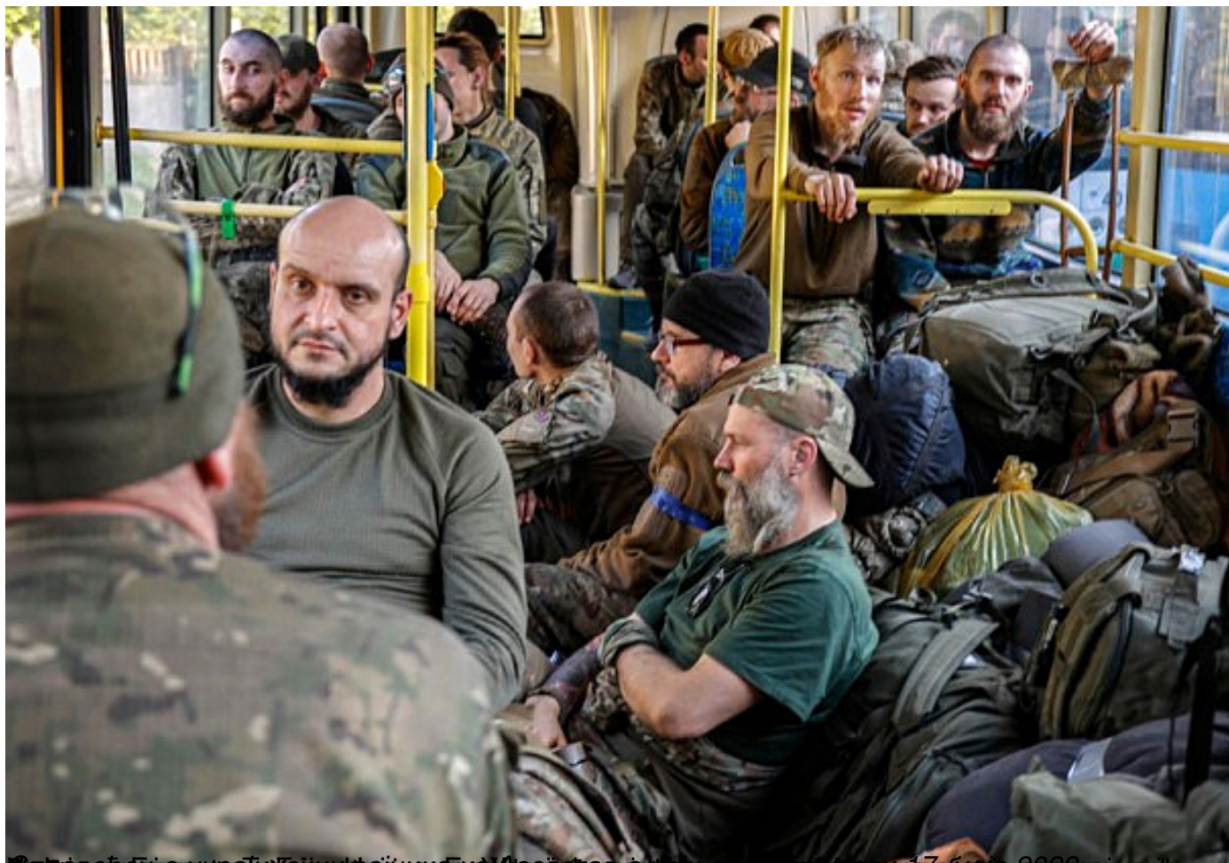
Војници српске војске у автобусу, 17. маја 2022. (својеручно)