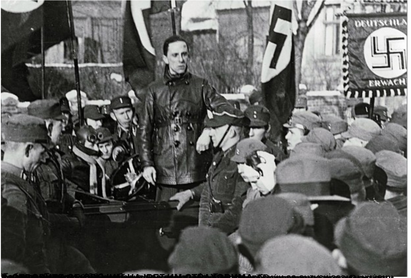
Adolf Hitler, 1933.