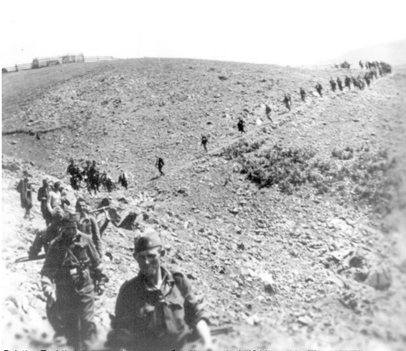
Слика из архива Војне историје, која приказује војнике у марширујућем редовима преко непријатељског терена током Другог светског рата.

Пише: Предраг Ј. Марковић недеља, 08 мај 2022 19:55