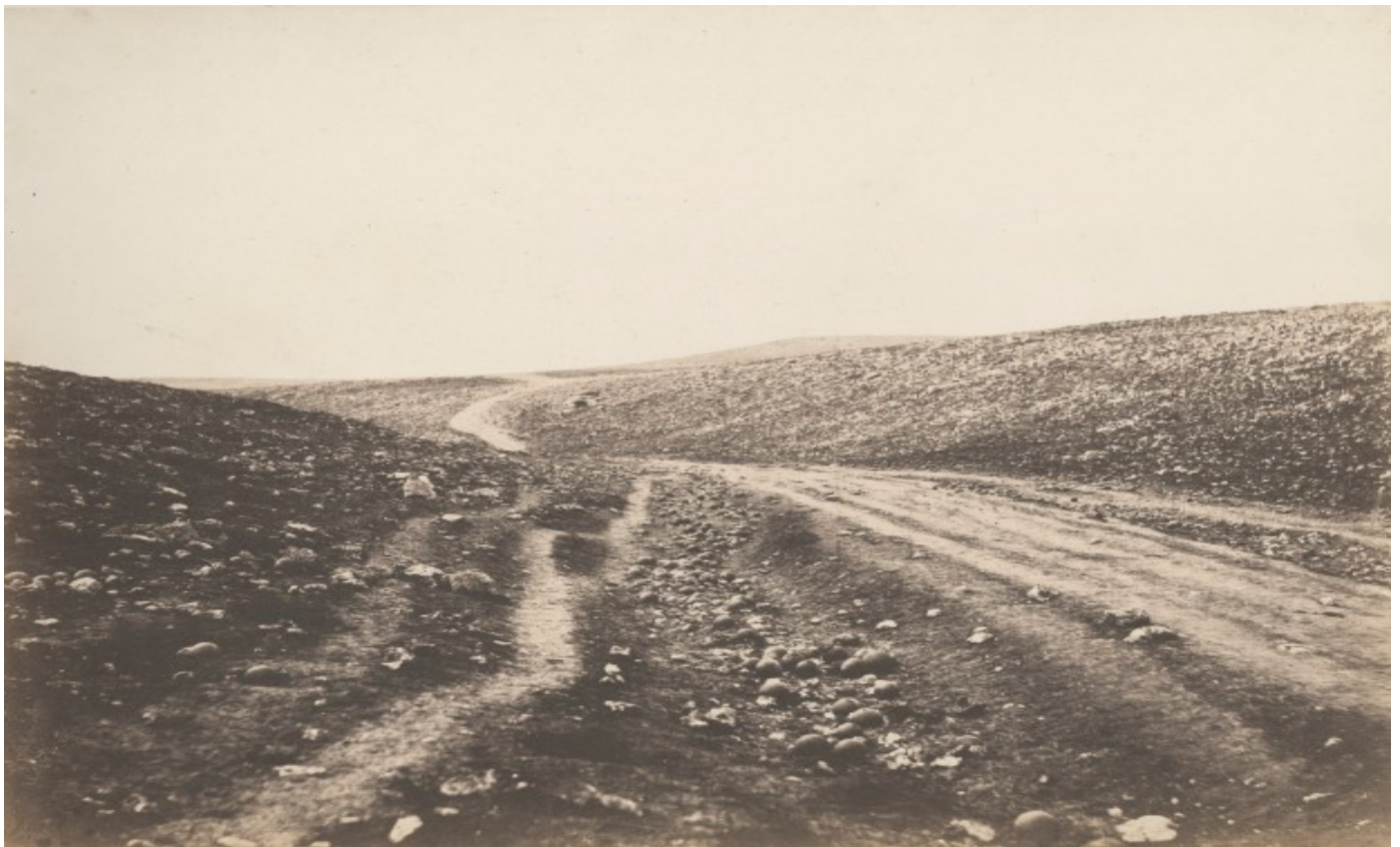
Долина смрти на фотографији Рочера Фентона 1855.

Књижевни критичари до дана данашњег нису сигурни да ли је Тенисон у поетском извештају о судбини лаке британске коњице на Криму ставио акценат на херојство или на глупост, то јест, да ли је био узвишен или ироничан. Лично, нагињем ка овом другом. Другачије и није могао да говори о том походу у ком је неко направио „blunder” (грешку, глупост, брљотину) него замотано и наоколо, јер би се иначе на њега обрушио бес патриотских медија, министарства војске, јавности, плус туге и беса породица палих. Јадни Тенисон се довијао да каже а да не каже.