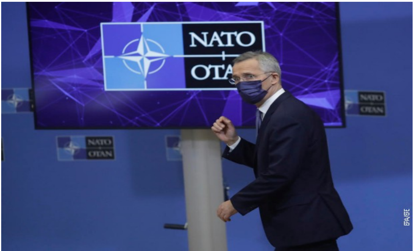
Генерални секретар НАТО-а Јенс Столтенберг

Поглед унатраг са задршком од двадесет и три године показује да је бомбардовање Србије 1999. било само раскопавање европске улице у комуналне сврхе. Онда се та рупа лепо насула, поставила се нова, не најмудрија улична сигнализација, али проблем је био тај да НАТО заправо није завршио посао. Сад копа другде, са много већим улозима.