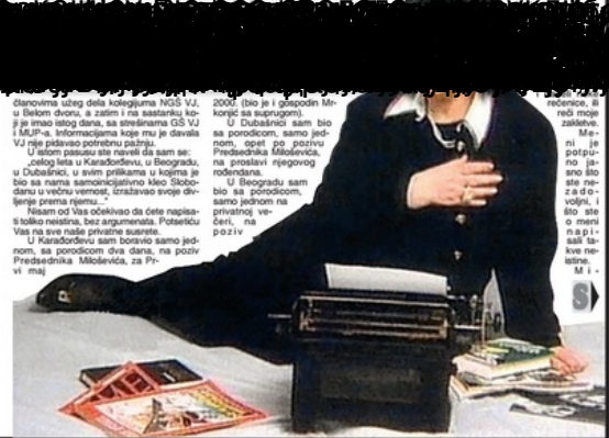
17. novembar 2015. Svedok

je zauzeto, trajalo je ceo dan. Kad sam jednom ušla u njegovu radnu sobu, zatekla sam zbujenog generala Nebojšu Pavkovića kako stoji nasred sobe, preko puta Slobodana, koji je sedeo u svojoj stolici na radnom stolu. Pitala sam ga šta se događa, kakav je njegov stav, ko je zauzima taj kaos u gradu. On mi kaže: „Nishta se tu ne moze. Gotovinu narod...“ Nisam mogla da ga preplavam. Na pragu od ovog osupnucenog, energičnog, u sebe skupiranog vojaka koji se misli leta i Karaborbeyu, u Beogradu, u Dublincima, u sam prikazava u kojima je bio sa nama samovojizacijano kles Slobodanu y