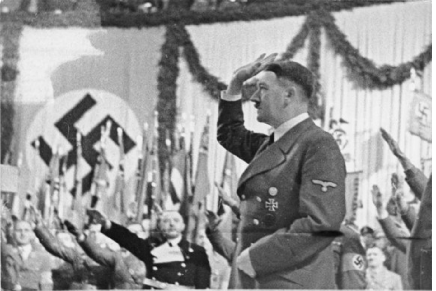
Bild 183-J00282 Hitler saluting, 10. Januar 1932

Пише: Цвијетин Миливојевић петак, 15 мај 2020 14:24