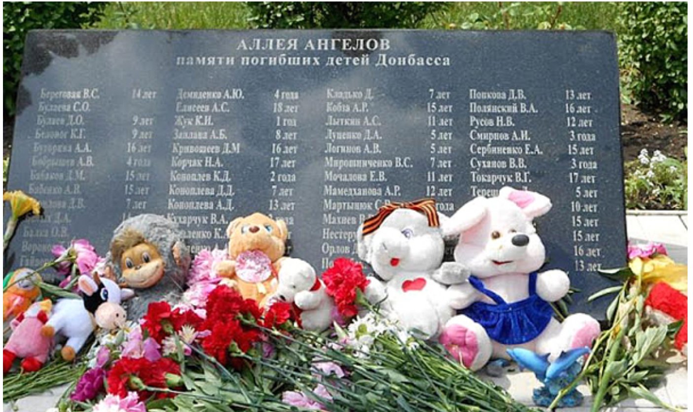
Алеја анђела на гробљу у Доњецку

Морамо, нажалост, да констатујемо да супротна страна на Западу изгубила осећај за реалност, прешли су све границе. А није требало.