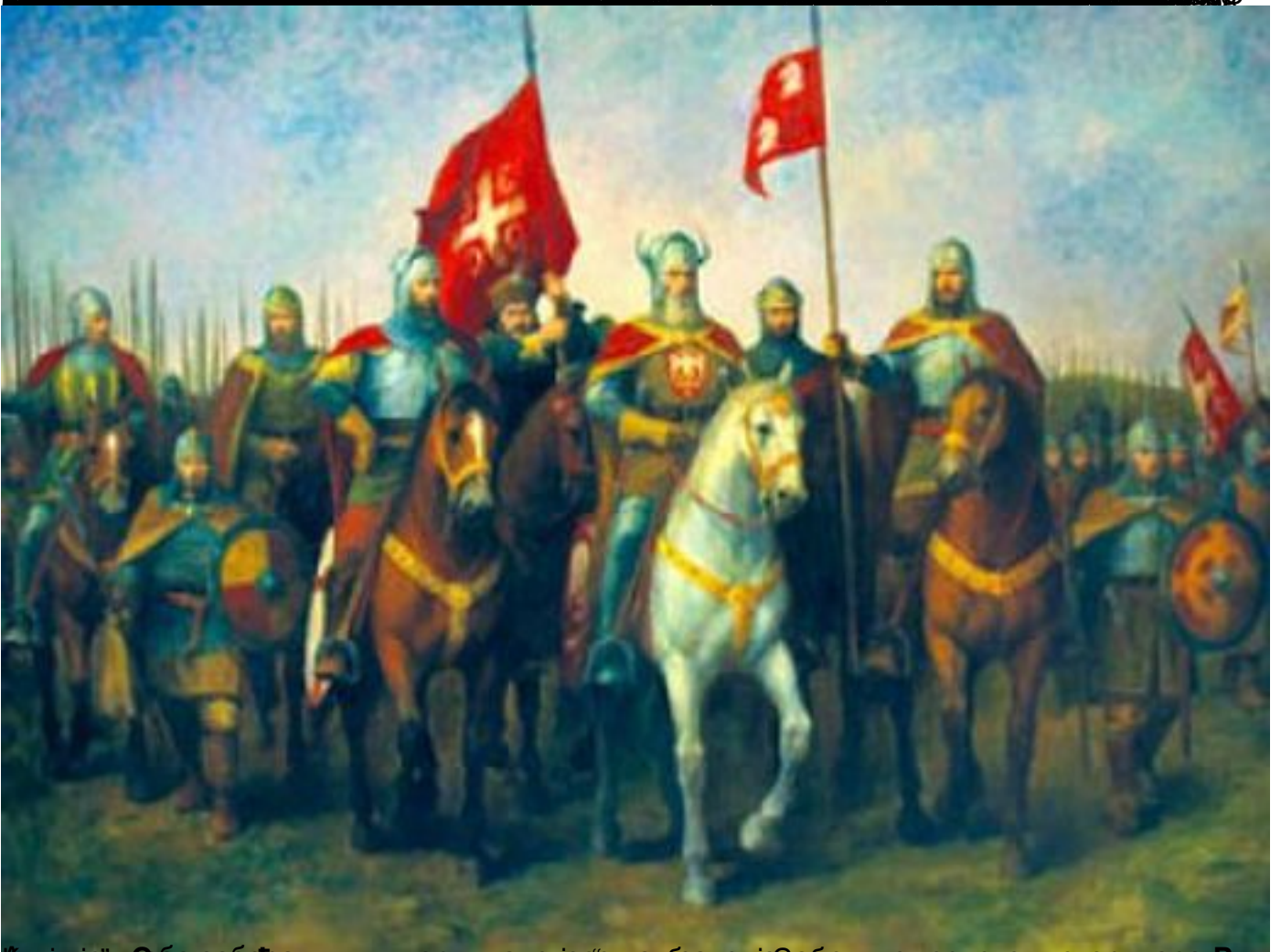
Илустрација преобразбе српске војскарице из српског историјара Р