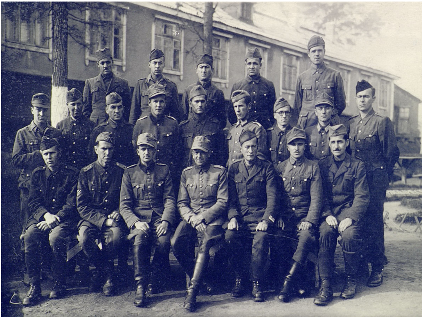
Фотографије војнослужачих Народно-ослободитељне армије Југославије, учествовајућих у ослобођењу родне земље.