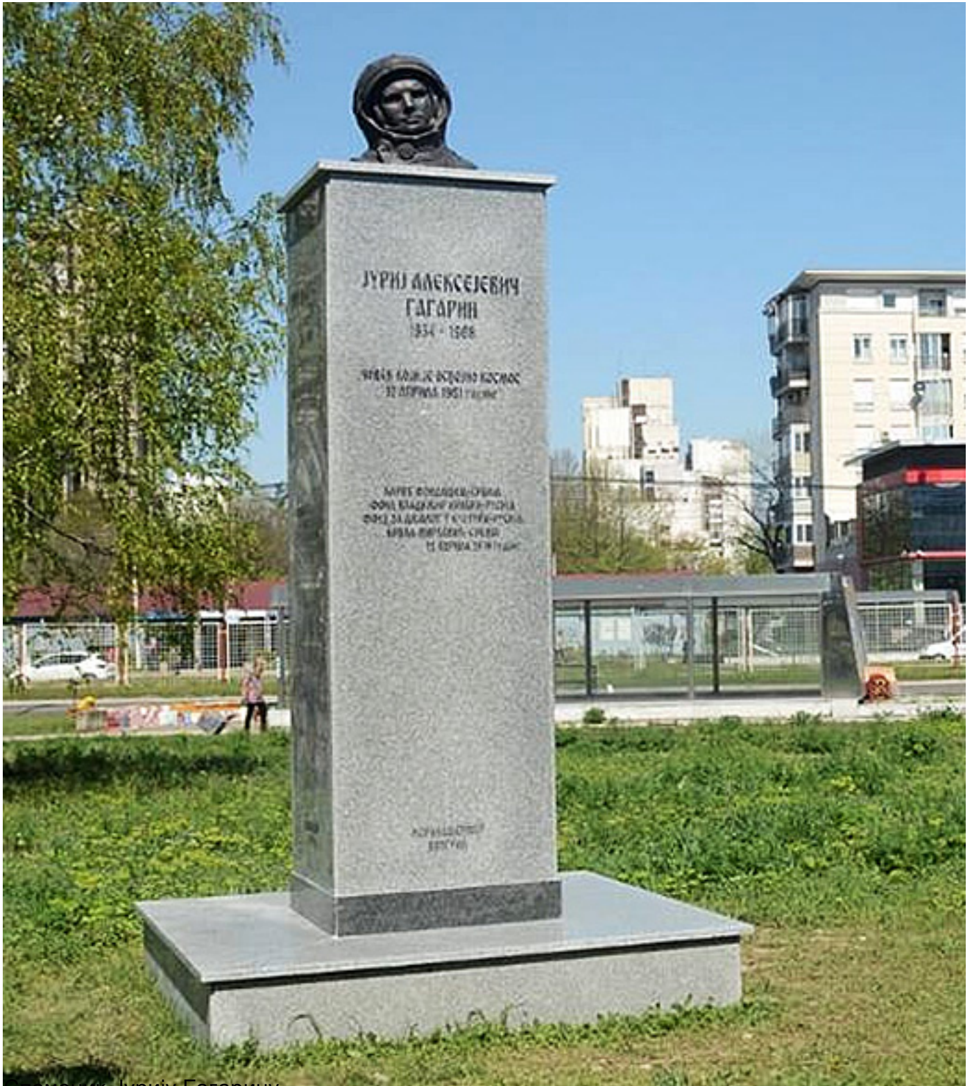
Споменик Јурију Гагарину

Пише: Никола Танасић петак, 21 август 2020 19:51