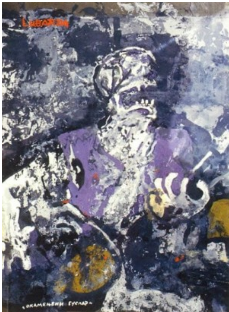
Петар Лубарда: Окамењени гуслар (1952)

Пише: Никола Танасић понедељак, 28 јун 2021 15:07