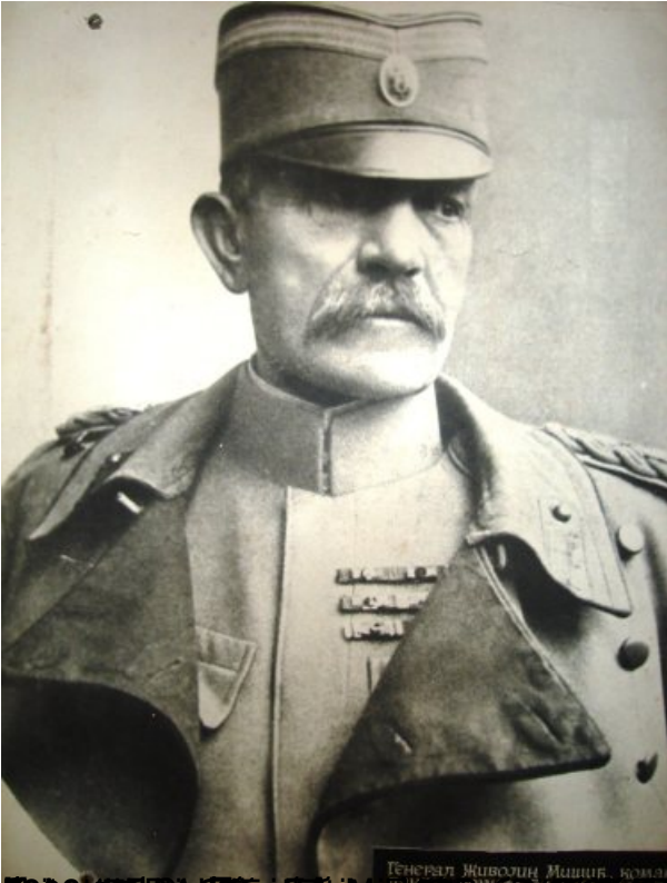
Генерал Живовин Мишић, командант војних јединица које су ослобађале Београд

Пише: Из архиве НСПМ - Златко Богатиновски понедељак, 20 октобар 2014 12:12