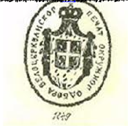
Грб Српске Војводине у документима 1848-1849. г.