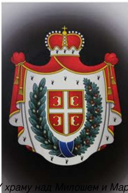
У храму над Милошем и Марком

Покрајинска влада Игора Мировића поднела је Нацрт одлуке о изгледу и коришћењу „традиционалних симбола“ АП Војводине. Намеравају да историјски грб Српске Војводине из XIX века прогласе војвођанским „традиционалним грбом“ како би прекрили аутономашку хералдичку срамоту из 2002. године, омогућили јој да опстане и да заузме место „историјског симбола Војводине“. Српска историјска знамена не смеју постати „смоквин лист“ за прикривање ликовног сведочанства аутономашке језуитске политике.