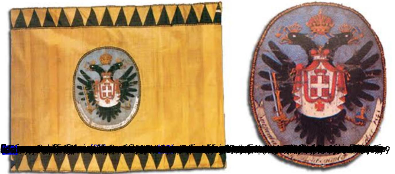
Грб Српске Војводине на стандарти српског војводе