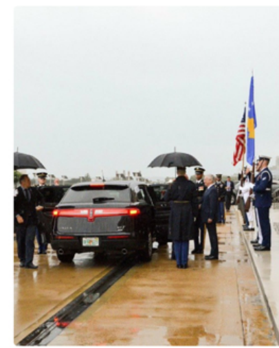
1:34 PM - 28 Sep 2018

Ramush Haradinaj @haradinajramush A great honor to meet @De #SecDef James Mattis at the Delighted to receive his will support #Kosovo in strengthening institutions and to further d #US strategic military & pol