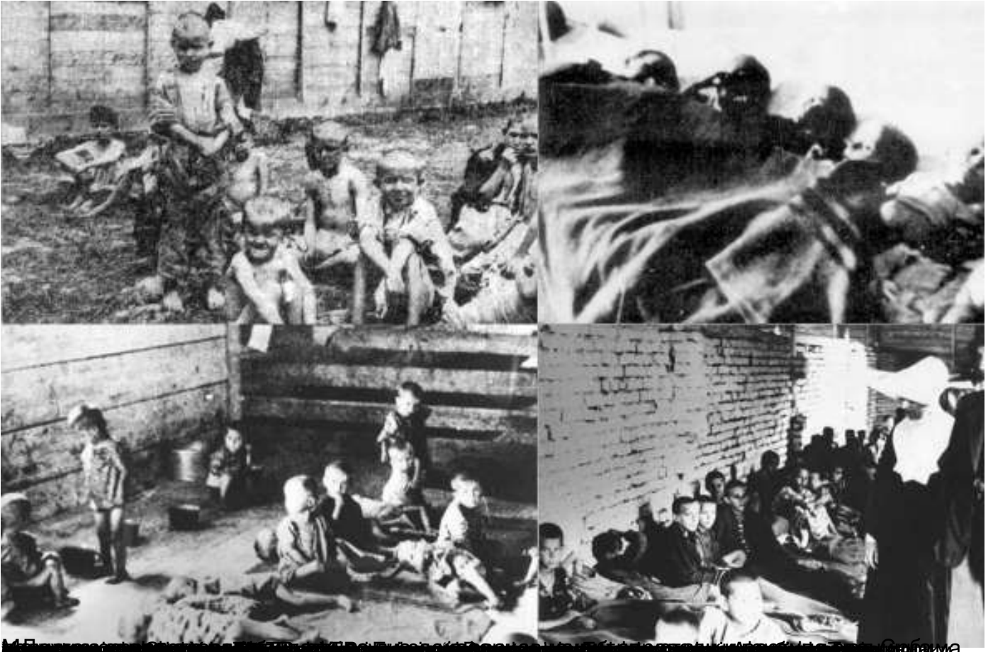
Детице у концентрацији Јасеновац (1941-42) и у концентрацији Јасеновац (1941-42)

Пише: Маринко М. Вучинић уторак, 26 јул 2022 09:25