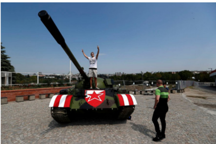
People pose with a former Yugoslav army T-55 battle tank seen in front of northern grandstand of Rajko Mitic stadium in Belgrade, Serbia, Tuesday, Aug. 27, 2019, placed as a gesture of support for the Red Star team. The decommissioned Yugoslav army tank once used during the bloody breakup of former Yugoslavia in 1990s, has been parked in front of the Red Star stadium before Tuesday's Champions League qualifier against Swiss champion Young Boys.