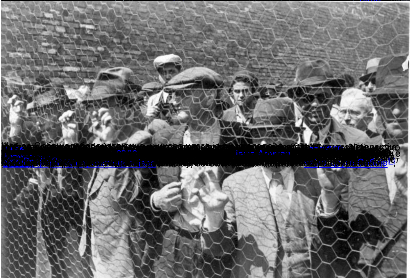
April 1941