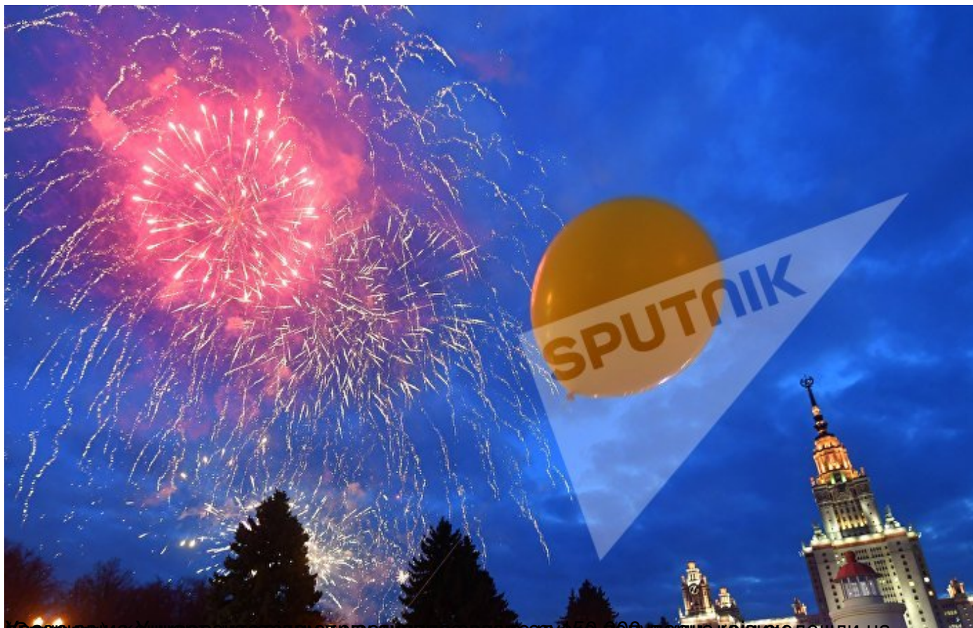
(Фрагмент) Како илустрација скриншота са сајта Sputnik, у којем се види сјајна светлост од свеобулаца које се дошли на