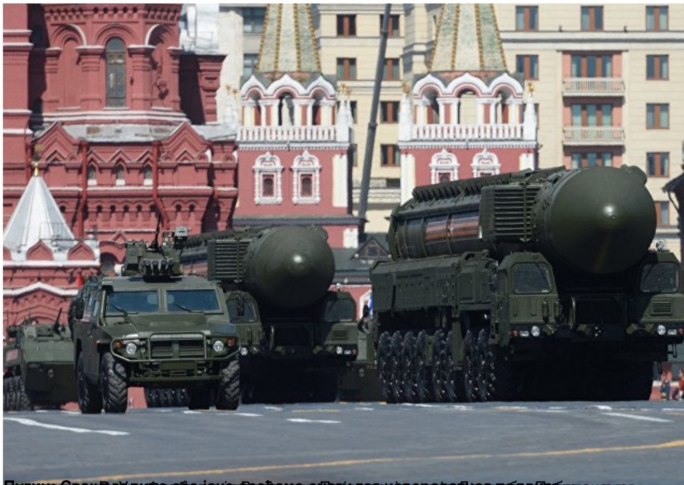
Парад војних возила са ракетама у Москви поводом Дана победе над фашизмом