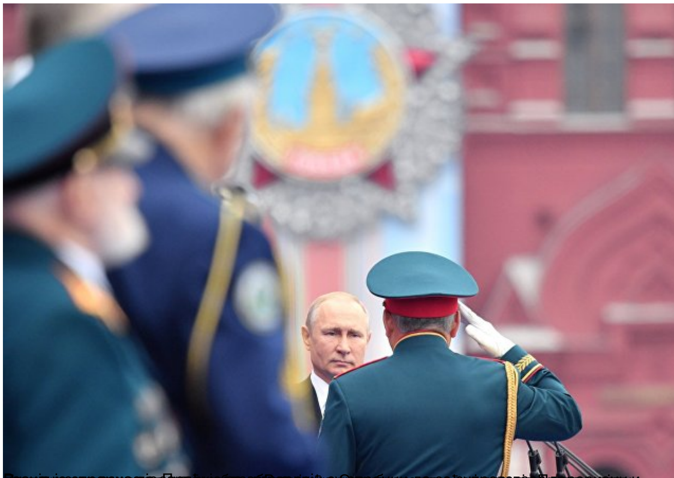
Војна парада у Москви поводом Дана победе над фашизмом. У центру је Владимир Путин. У позадини се види војник у зеленој униформи који салује.