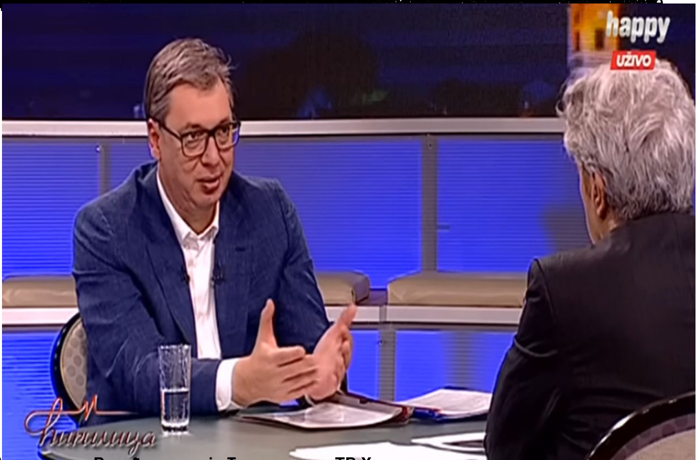
Александар Вучић у емисији Тирлица на ТВ Хеви