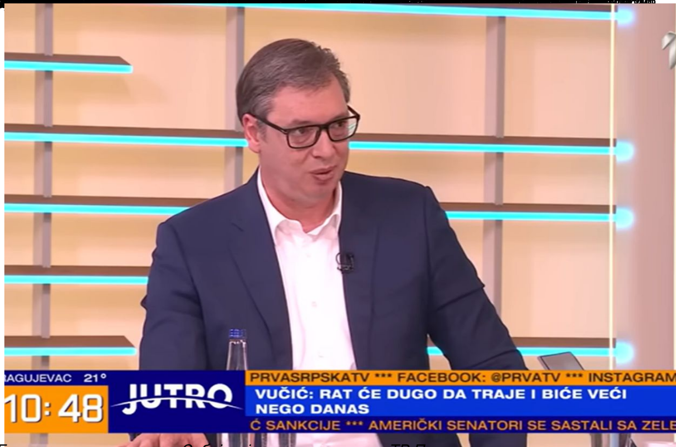
Гостовање председника Србије у јутарњем програму ТВ Прва