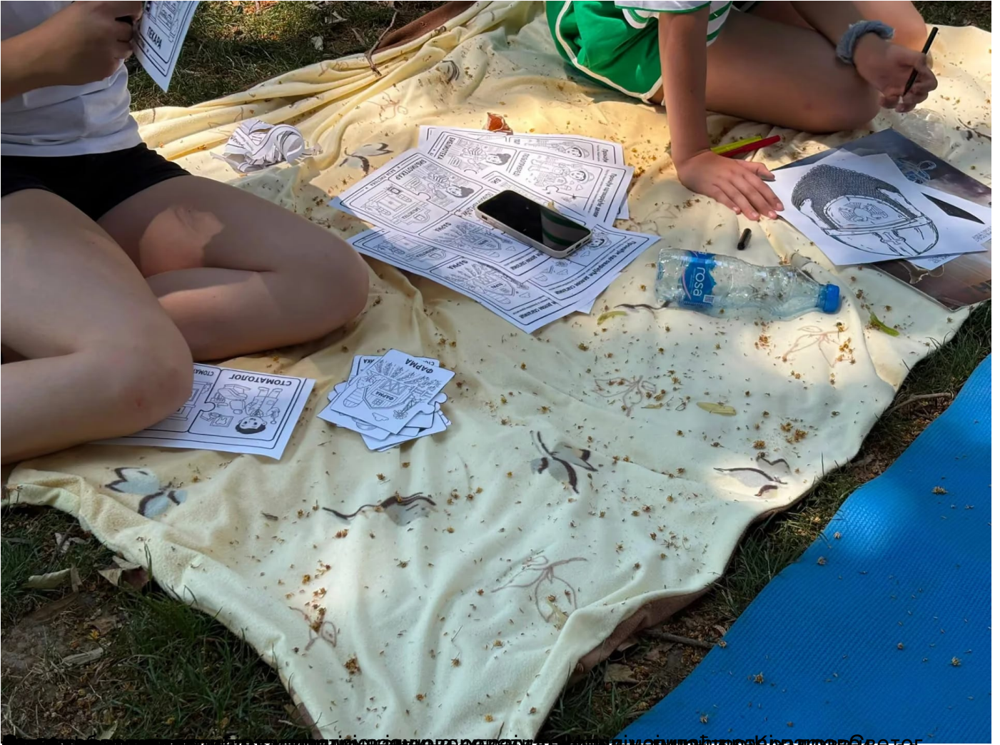
Студенти на Видовдану у Краљеву. На слици се види део сајамског дела са илустрацијом СНС-овог картела. Деца са Кривопањом и Метохије