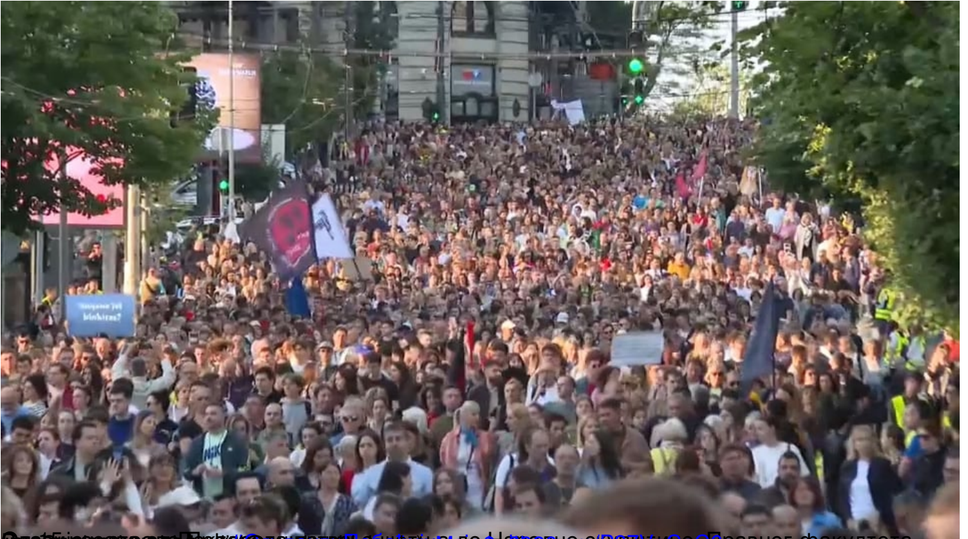
Студенти најавили акцију "(Не) бојте се, и даље смо ту" 10. маја у Београду: Најављена шетња од Републике до Српског правосудног факултета, петак, 08 мај 2026 23:08