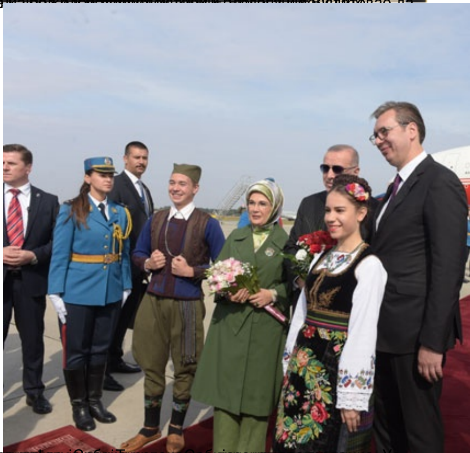
12. Октобар, Београд, Србија. Президенту Републике Србије Александру Вучићу долази на дочек у аеродрому Србија у Београду председник Републике Турске Реџеп Тајип Ердоган. Уз њих стоје чланови Српског народног ансамбла у традиционалним српским народним костимима.