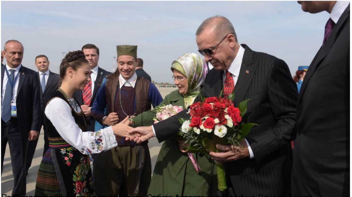
Ердоган држећи у руци букет цвећа, додељује га Српкиња.