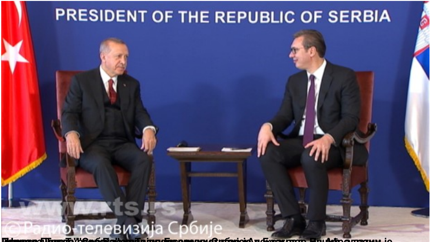
Илустрација: Пилета у Србији / Анкетант: Бил Агостини / и