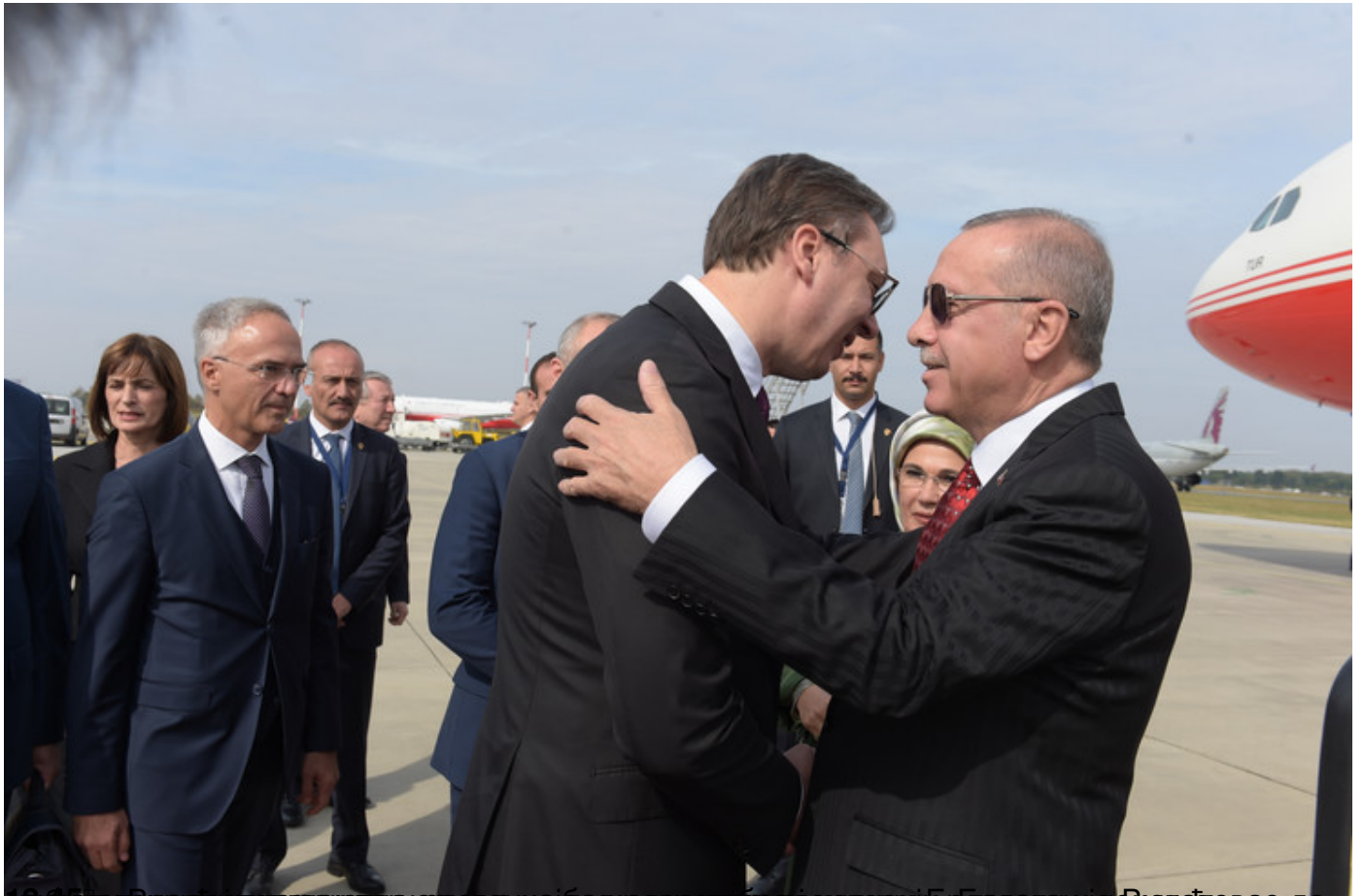
6. Октобар, Врхуњац, Србија. Президенту Републике Србије Александру Вучићу долази на дочек у аеродрому Србија у Београду председник Републике Турске Реџеп Тајип Ердоган.