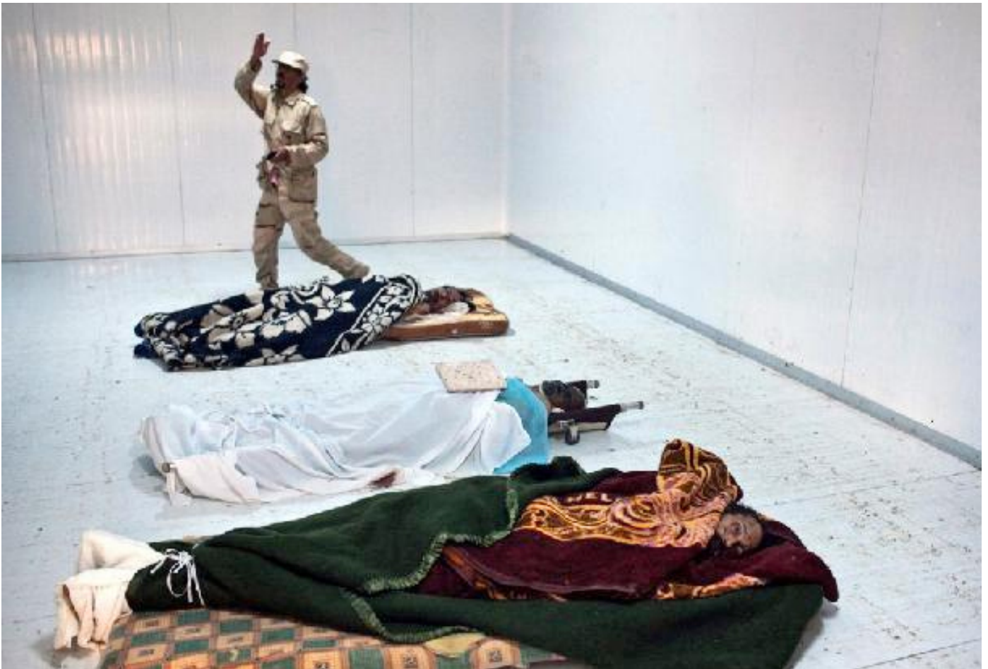
Тела Моамера и Мотасиома Гадафија у хладњачи у Мисрати

Готово истовремено, Гадафијеве присталице појачале су притисак на власти да, безмало пет месеци након убиства Гадафијевог сина и несуђеног наследника, Сејфа ел Ислама, открију и правди приведу починиоце овог злочина.