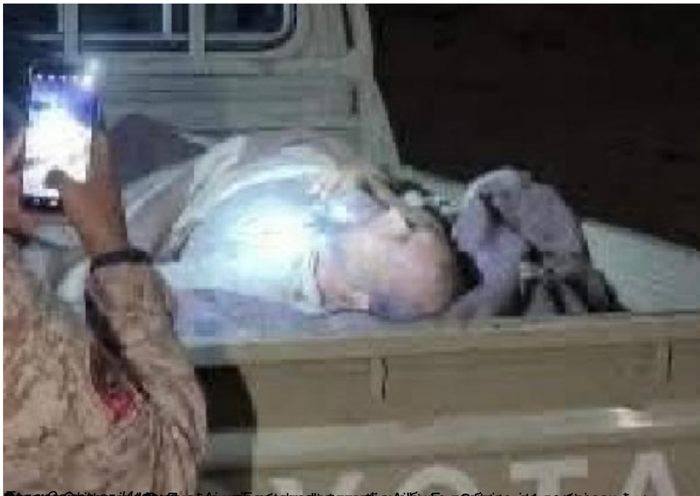
Потрага за гробом Моамера ел Гадафија и убицама Сејфа ел Ислама у