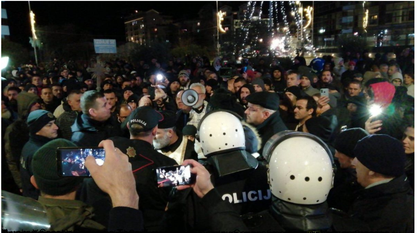
Спутњик: Полиција у Зети бацила сузавце на грађане који су се окупили испред Храма Христовог