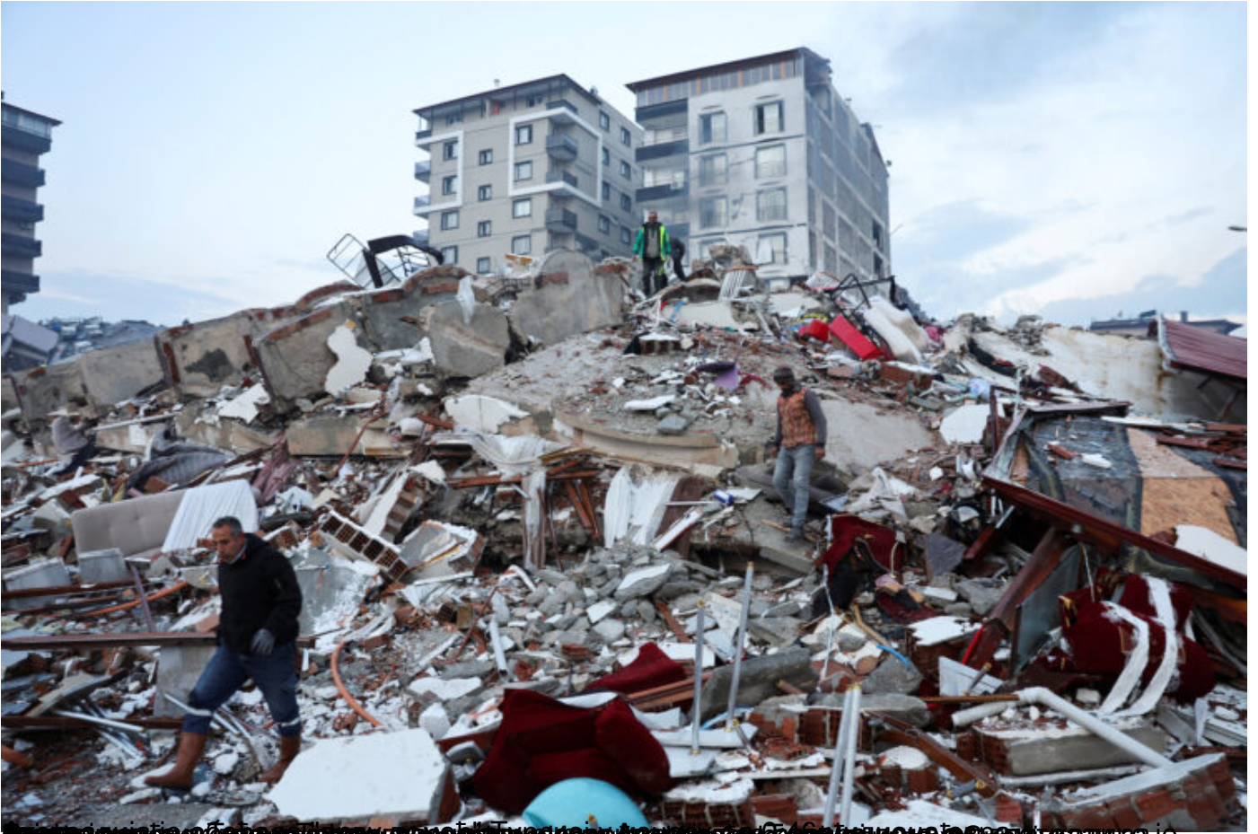
Слика је аутоматски генерирана од стране AI и може да садржи нетачности.