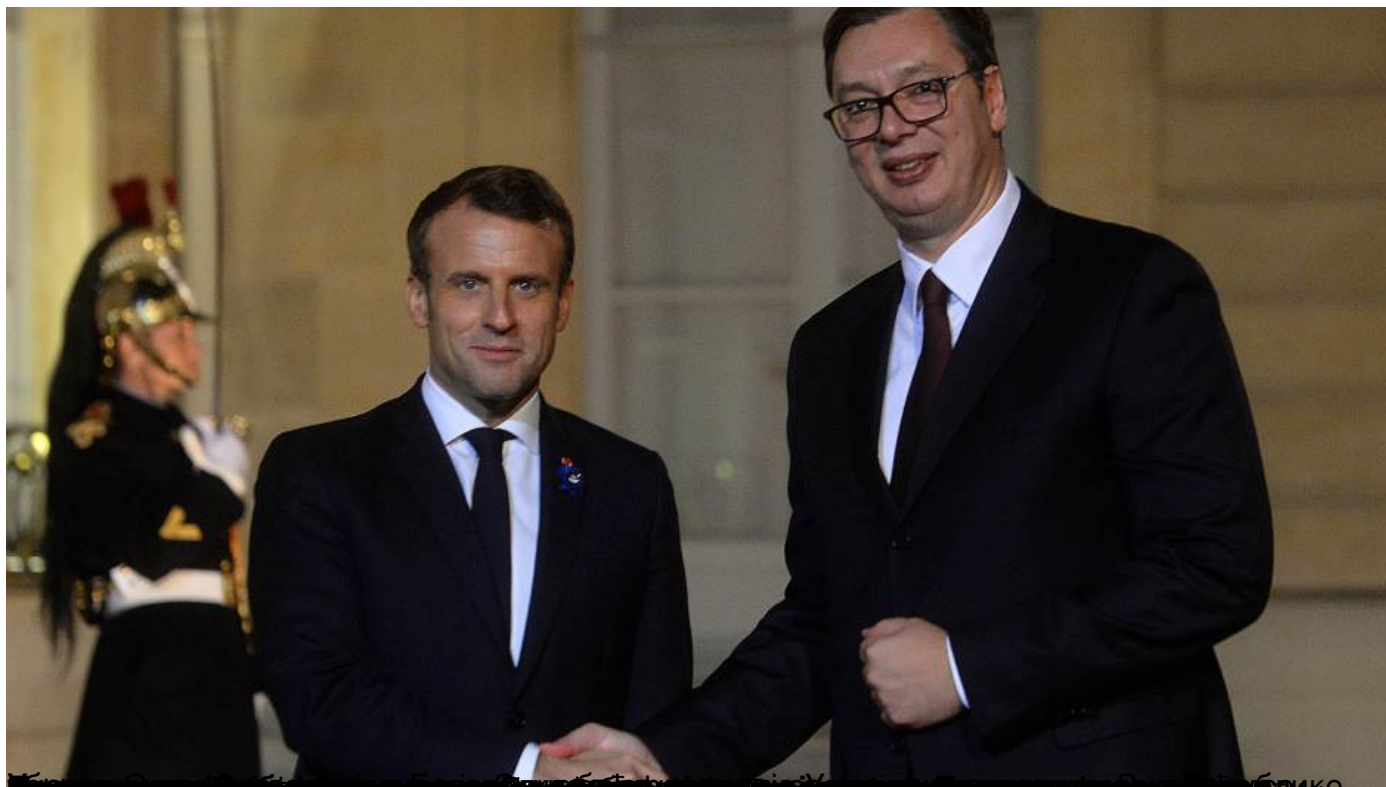
мировни Харис Улаха Србљану срмћу др се по бојотрав де срце наје из ланача у УН