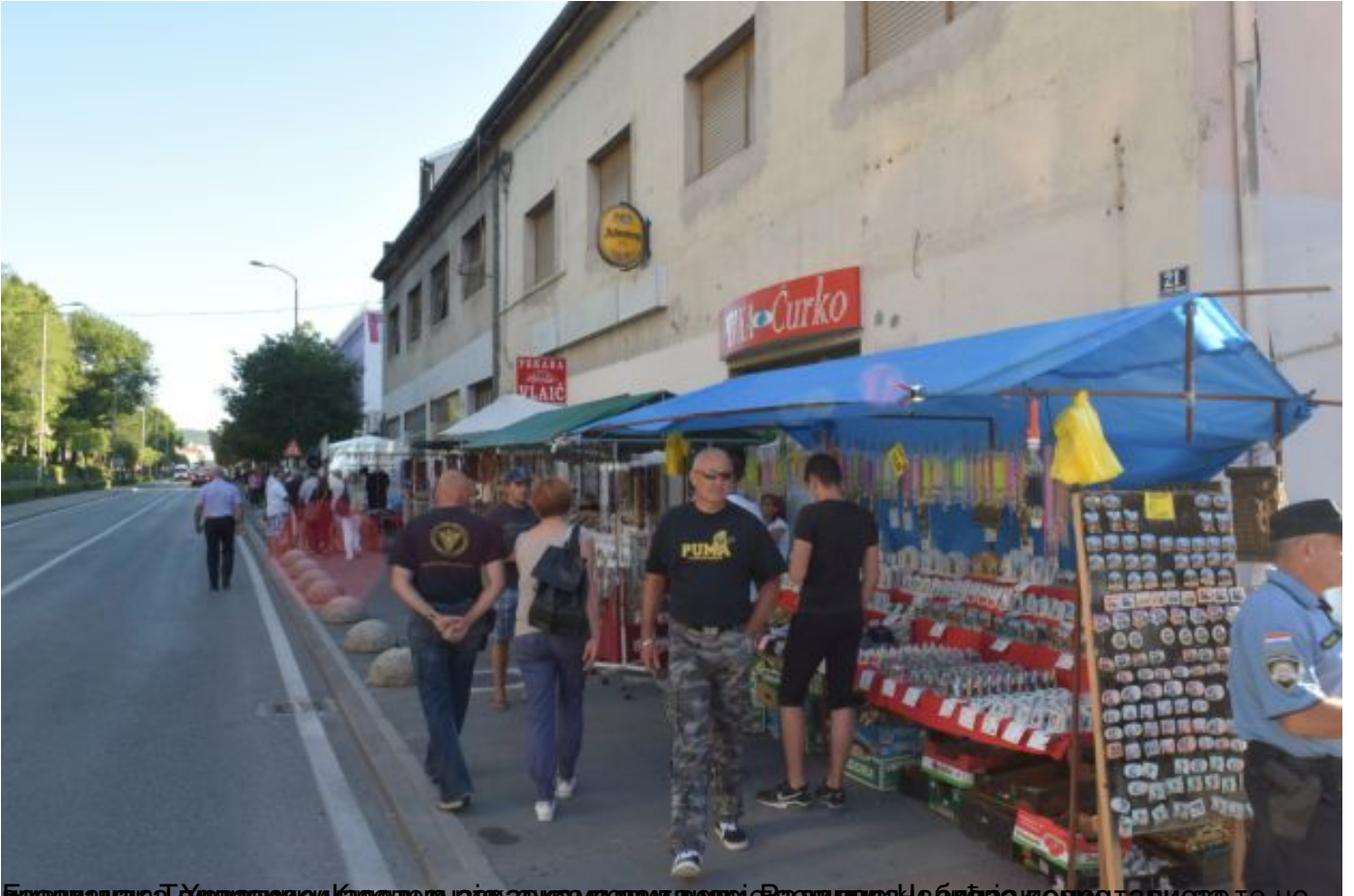
Бивши градоначелник Хрватске у Карловачкој, а сада у Радимировој, Небић је кренуо са својим тимом да се прослави 22. годишница војне операције "Олуја" коју Хрвати славе као „Дан побједе“.