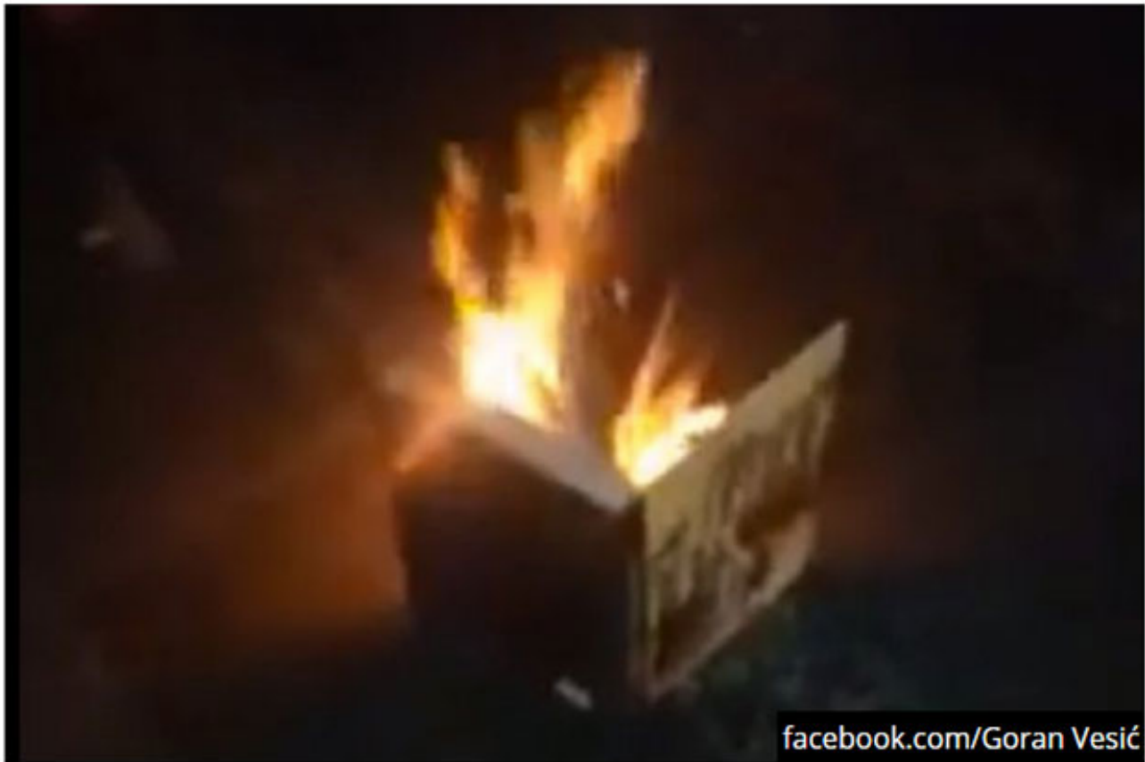
Trenutak kada okunjeni pale Vesićevu knjigu

AUTOR: Republika ponedeljak, 14. 10. 2019. | 22:37 4