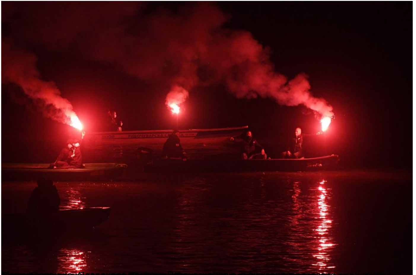
Неколико хиљада Новосађана на Кеју жртва рације опростило се од Ђорђа Балашевића