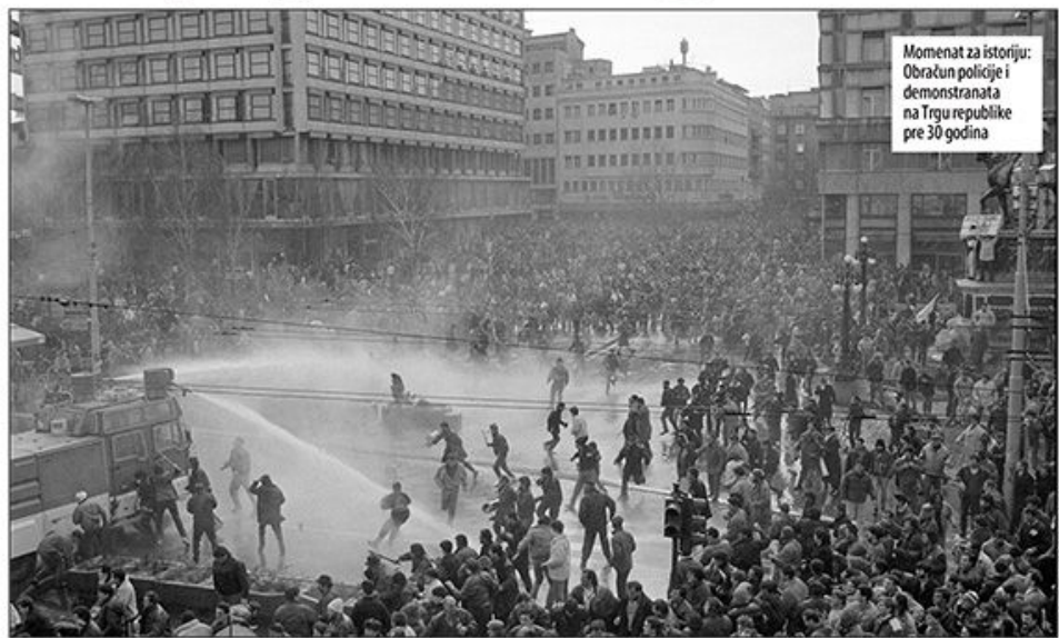
Moment za istoriju: Oračun policije i demonstranata na Trgu republike pre 30 godina