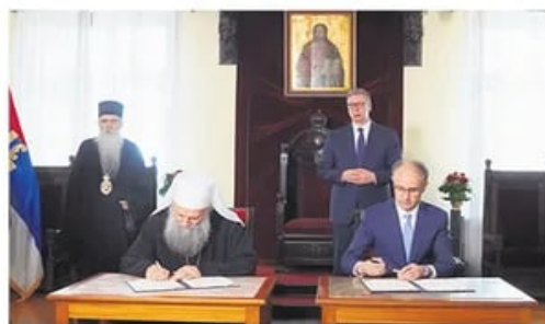
Потписе на документ ставили су патријарх Порфирије и премијер Буро Мачућ

Потписивање Меморандума о сарадњи на оснивању Универзитета „Свети Сава“ између Републике Србије и Српске православне цркве огроман је корак напред у начину, моделу, али и приступу образовању будућих генерација, рекао је јуче председник Александар Вучић после потписивања овог акта у Патријаршији. Патријарх Порфирије изјавио је да се оснивањем овог универзитета наставља дубок и историјски утемељен просветни пут СПЦ, српског народа и српске државе. Меморандум су потписали патријарх српски Порфирије и премијер Буро Мачућ, а присуствовали су председник Вучић и министар просвете Дејан Вук Станковић. Вучић је казао да народ без образовања нема будућност и да наша просвета никада није била одвојена од вере. страница 8