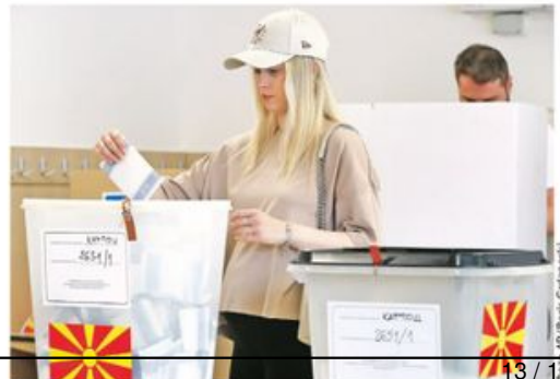
Гласање у Скопљу за председника државе и Собрание