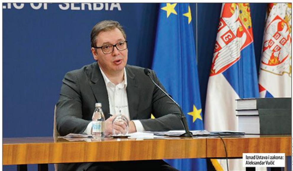
Iznad Ustava i zakona: Aleksandar Vučić