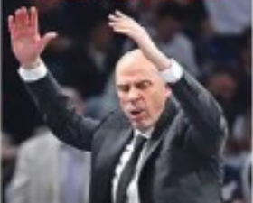
PARTIZANU KRADU PENJAROJU?