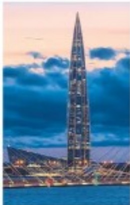
Садница „Гастромџофна“ у Санкт Петербургу

Током прве фазе радова кинеска компанија „Шандонг“ изградиће 83 километра до 2029. године, а у другој, која ће бити завршена до 2035, још 42 километра, истакао је председник Србије