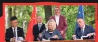
Potpisan ugovor o izgradnji puta „Vožd Karađorđe“ Saobraćajnica od 125 km povezaće Šumadiju i Pomoravlje

● Da li smo nešto bolje to prihvatili nego neko drugi? Jesmo, zato što smo dobro radili. Ali da li je dobro? Ne, nije dobro. I mi osećamo posledice i te kako danas, rekao je Vučić