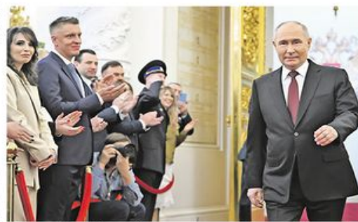
Свечаност у Великој палати Кремља

Владимир Путин јуче је званично започео пети мандат на положају председника Руске Федерације након полагања заклетве у Великој палати Кремља. Он ће на функцији остати наредних шест година, до 2030. године, преноси РИА Новости. Путин је на председничким изборима у Русији, одржаним од 15. до 17. марта, освојио 87,28 одсто гласова.